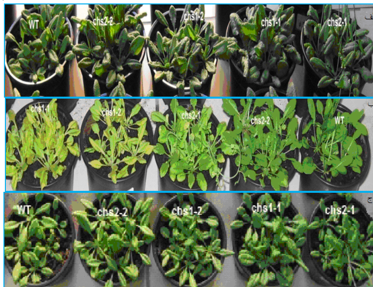
شکل ۱. گیاهان تحت تیمارهای دمایی متفاوت. الف) گیاهان شاهد، ب) گیاهان تحت تیمار سرما، ج) گیاهان تحت تنش سرما

ویژگی‌های مورفولوژیکی ناشی از دمای پایین در گیاهان جهش یافته آرابیدوپسیس تحت تیمار سرما مشاهده شد. تحت این تیمار دمایی برگ گیاهان جهش یافته زرد شد و پس از یک هفته قرارگیری در معرض تیمار سرما همه این گیاهان از بین رفتند و با بازگشت به دمای رشد نرمال زنده نماندند (شکل ۱ ب). تحت تنش سرما و شاهد گیاهان وحشی و جهش یافته ظاهر طبیعی داشتند و ویژگی مورفولوژیکی خاصی نشان ندادند (شکل ۱ الف ج).