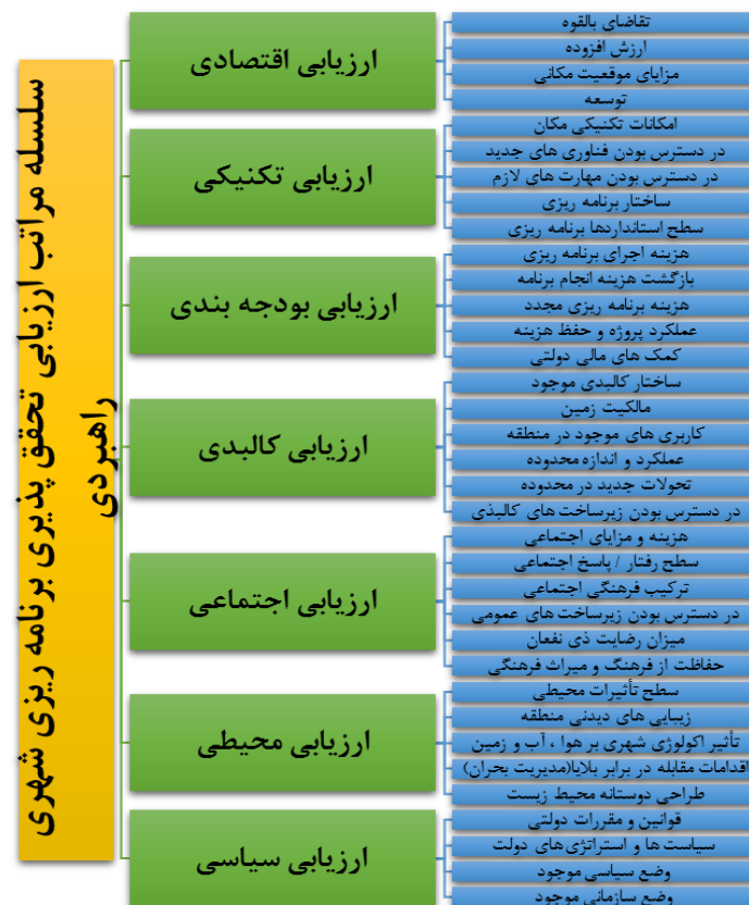
تصویر (۱): سلسله مراتب ارزیابی تحقق‌پذیری برنامه‌ریزی شهری راهبردی

شاخص‌های مورد بررسی شامل ۷ شاخص به صورت ذیل می‌باشد، شاخص اقتصادی با ۴ گویه، شاخص تکنیکی با ۵ گویه، شاخص بودجه بندی با ۵ گویه، شاخص کالبدی با ۶ گویه شاخص اجتماعی با ۶ گویه، شاخص محیطی با ۵ گویه و شاخص سیاسی با ۴ گویه می‌باشند.