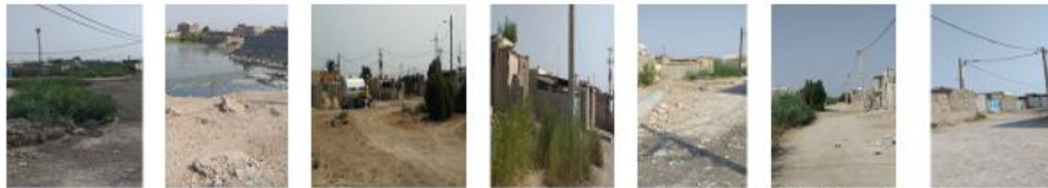
شهرک ولی عصر (گاما) تلمبه خانه شماره ۴ جرف الملق شهرک صباغان (کمپ B) ایستگاه ۷ نيزار دو نيزار یک

شکل ۳- تصویر هفت منطقه حاشیه‌نشین شهر بندر امام خمینی