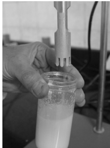
شکل ۳- امولسیفیکاسیون مخلوط اجزاء