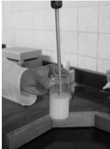
شکل ۲- مخلوط کردن اجزاء مولسیون