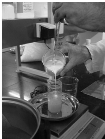
شکل ۱- افزودن خامه به روغن کره

جامد سازی امولسیون: برای این کار در بیشتر موارد از دستگاه بستنی ساز خانگی استفاده می‌شود. برای استفاده از این دستگاه، بایستی آن را قبلاً حداقل به مدت 12 ساعت در یخدان یخچال گذاشت تا مبرد آن (پروپیلن گلیکول) که در جدار بیرونی محفظه‌ی جامدسازی است، منجمد شود. امولسیون در اثر تماس با جداره‌ی داخلی این محفظه به سرعت حرارت خود را از دست می‌دهد و سفت می‌شود. دستگاه یک هم زن پلاستیکی دارد که محتویات آن را پس از سرد شدن، از روی سطح داخلی دستگاه جدا می‌نماید. مراحل مختلف تهیه‌ی نمونه‌ها در شکل ۱ تا ۴ نشان داده شده است.