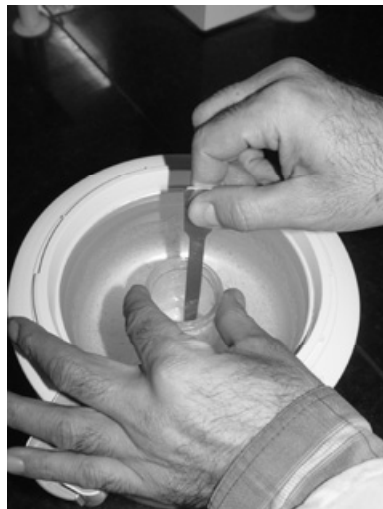
شکل ۴- جامدسازی امولسیون