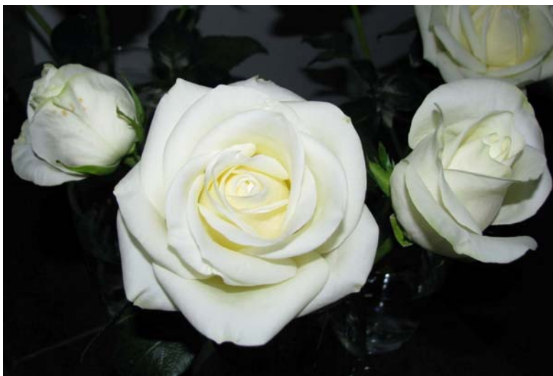
شکل ۱- گل بریدنی رز رقم ستاره قطبی در مرحله برداشت مناسب

گل بریدنی رز، پژمرده شدن گلبرگ‌ها، برگ‌ها و یا خم شدن ساقه گل در نزدیکی گردن یا به عبارت دیگر ظاهر شدن علامت ناهنجاری فیزیولوژیکی گردن کج بود.