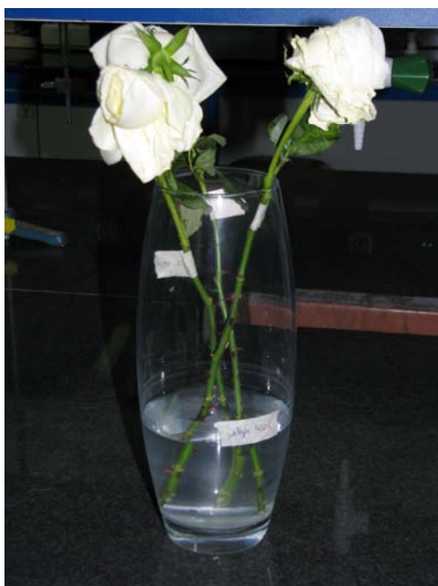
شکل ۲- پدیدار شدن عارضه گردن کج و پژمردگی زودهنگام در گل های بریدنی رز ستاره قطبی در نتیجه تیمار شدن با هیپوکلریت کلسیم