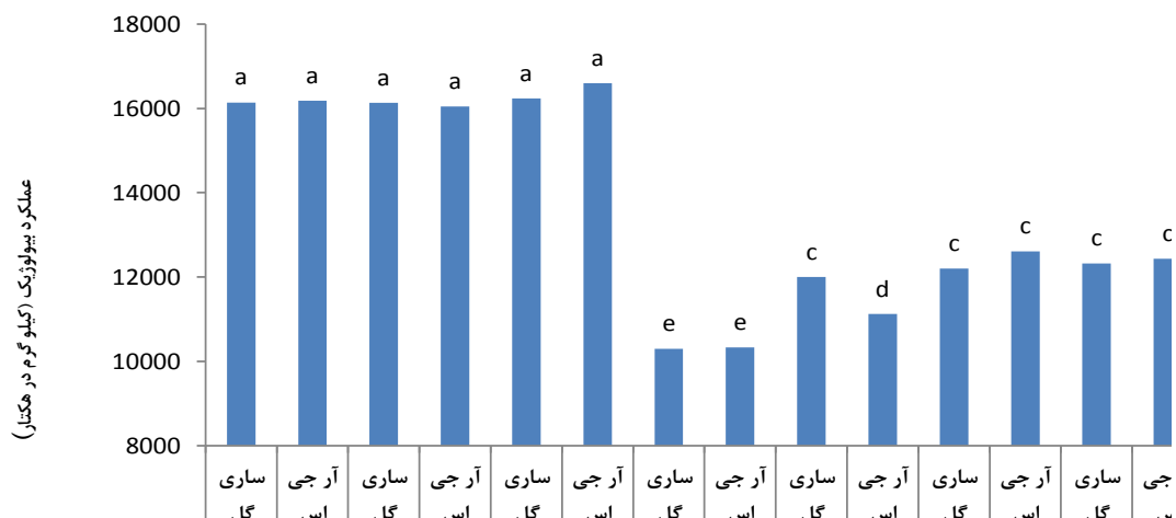
شکل ۱- برهم‌کنش تیمارهای آبیاری، روش‌های کاربرد کود شیمیایی فسفر و رقم بر عملکرد بیولوژیک کلزا. میانگین‌های دارای حروف مشترک بر اساس آزمون چند دامنه‌ای دانکن در سطح احتمال ۵٪ تفاوت معنی‌داری ندارند.

پژوهش معنی‌دار بود. مقایسه میانگین‌ها نشان می‌دهد که بیشترین عملکرد دانه به رقم آرجی اس با میانگین 5736/78 و کمترین عملکرد دانه به رقم ساری گل با میانگین 4685/5 کیلوگرم در هکتار تعلق دارد. خوش نظر و همکاران (۲۰۰۰) بین ارقام مختلف کلزا تفاوت معنی‌داری در عملکرد دانه مشاهده کردند. طبق جدول تجزیه واریانس اثر شیوه‌های کاربرد کود شیمیایی فسفر بر عملکرد دانه معنی‌دار نشد (جدول ۲). مشابه با نتایج این پژوهش، مک لارن و کامرون (۲۰۰۶) نشان دادند که اثر روش‌های مصرف فسفر بر عملکرد دانه کلزا معنی‌دار نیست.