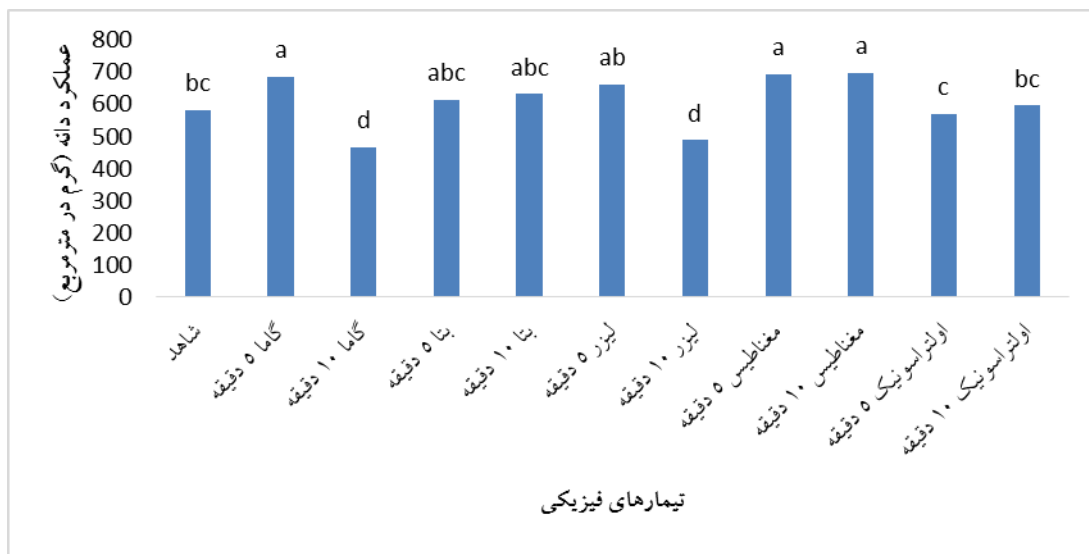
شکل ۲- تأثیر پرایمینگ بذر بر عملکرد دانه ذرت

حالی که اشعه‌های گاما و لیزر ۱۰ دقیقه‌ای کمترین عملکرد دانه را به دنبال داشتند. بنابراین، هر چند اثر متقابل سطوح پرایمینگ در سطوح دور آبیاری معنی‌دار نبود، اما پرایمینگ بذر با سطوح یاد شده عملکرد دانه را در مقایسه با تیمار شاهد بدون پرایم افزایش داد.