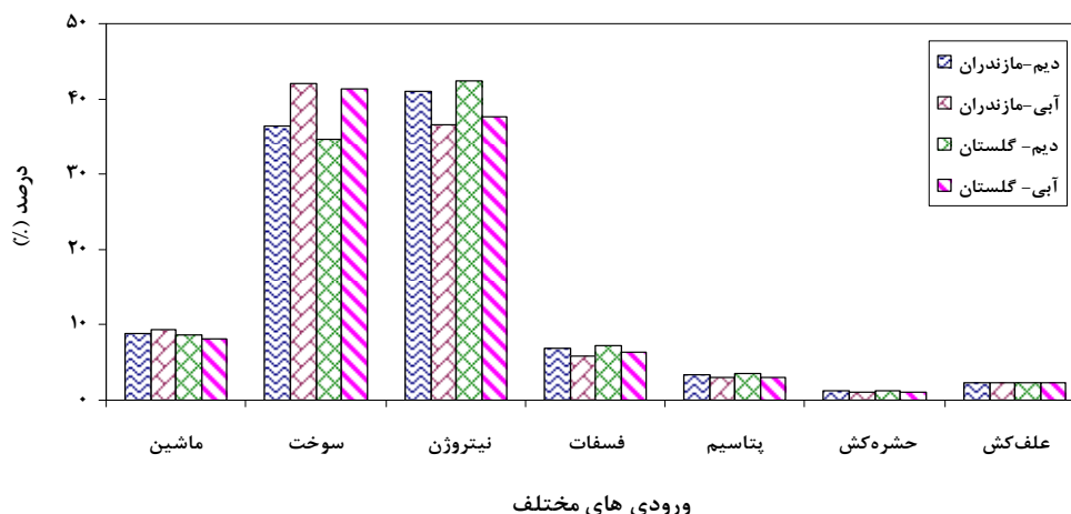
شکل ۱- درصد سهم انرژی ورودی‌های مختلف در دو کشت دیم و آبی در استان‌های شمالی کشور

شکل ۱ درصد سهم هر یک از ورودی‌های مختلف را در دو استان مازندران و گلستان در کشت دیم و آبی نشان می‌دهد. همانطور که از شکل ۱ پیداست بالاترین سهم مربوط به انرژی سوخت و انرژی کود نیتروژن و پایین‌ترین سهم مربوط به سم