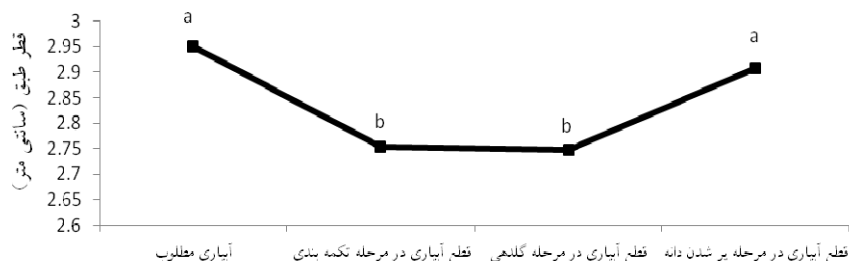
شکل ۲- مقایسه میانگین قطر طبق گلرنگ تحت تاثیر رژیم های مختلف قطع آبیاری

آبیاری ( I_2 ) دیده شد (جدول ۳). کاهش ۲۱/۷۹ درصدی وزن هزار دانه در تیمار ( I_2N ) نسبت به تیمار ( I_1T )، کارایی بهتر در تلفیق کود زیستی با کود نانو و کود شیمیایی تحت آبیاری مطلوب نسبت به کاربرد تنهای کود نانو تحت قطع آبیاری در مرحله تکمه‌بندی را نشان می‌دهد که این یافته را می‌توان از طریق کارایی بهتر سیستم‌های تلفیقی در افزایش فعالیت‌های میکروبی و آنزیمی و آزادسازی عناصر غذایی موجود در کلونیدهای خاک نسبت به سایر سیستم‌ها توجیه کرد (مونتومورو، ۲۰۰۹).