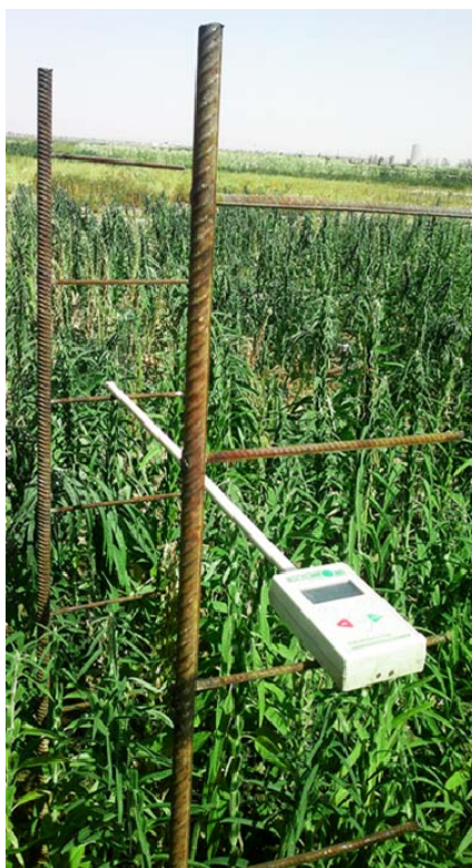
شکل ۱- پایه‌های تعبیه شده و نحوه قرارگیری سیتومتر خطی جهت اندازه‌گیری تشعشع لایه‌های مختلف کانوبی در هر کرت آزمایشی

گلدهی (حدود ۳۵ روز پس از کاشت)، با سرعت زیادی افزایش یافت و پس از گلدهی کامل و کاسته شدن از روند افزایشی مرحله قبل، کلیه تیمارها هنگام شروع رسیدگی فیزیولوژیک به حداکثر مقدار شاخص برگ رسیده و پس از آن کاهش یافتند (شکل ۲). پس از توسعه شاخص سطح برگ و سایه‌اندازی برگ‌ها بر روی یکدیگر، گسترش روزانه سطح برگ به مقدار ماده خشک اختصاص یافته به برگ‌ها بستگی خواهد داشت (نصیری‌محلای، ۱۳۷۸ الف). در گیاهان زراعی دانه‌ای، پیر شدن برگ‌ها عمدتاً تحت تاثیر رشد دانه‌ها و انتقال مجدد نیتروژن از برگ‌ها به دانه‌ها قرار دارد (سینکلیر و همکاران، ۲۰۰۳) بنابراین با نزدیک شدن به پایان فصل رشد و افزایش انتقال مجدد، روند پیری برگ‌ها و در نتیجه کاهش شاخص سطح برگ شدت بیشتری می‌یابد.