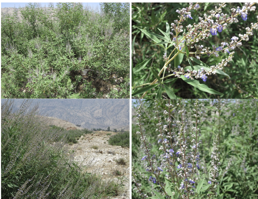
شکل ۱- گیاه پنج انگشت