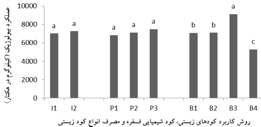
شکل ۳- اثرات ساده روش‌های کاربرد کودهای زیستی، کود فسفره شیمیایی و مصرف کودهای زیستی بر عملکرد بیولوژیک (روش کوددهی زیستی) I1, I2 به ترتیب ۱- کاربرد کود زیستی در عمق ۴ سانتی متر در خاک ۲- کاربرد کود زیستی همراه با بذری (تلقیح با بذری) P1, P2, P3 به ترتیب شامل ۱-مصرف کود فسفات ۲-مصرف ۵۰ درصد کود فسفات ۳- مصرف ۱۰۰ درصد فسفات) و B1, B2, B3, B4 به ترتیب ۱-ازتوباکتر ۲- سودوموناس ۳-ازتوباکتر + سودوموناس ۴-شاهد (بدون تلقیح)

دارای بیشترین مقدار بود که نسبت به تیمار شاهد (۵۲۸۳ کیلوگرم در هکتار) ۷۲ درصد افزایش نشان داد (شکل ۳). و همچنین میانگین‌های اثر متقابل دو عامل روش‌های کاربرد کودهای زیستی و کود شیمیایی فسفره نیز دارای اختلاف معنی‌داری بود و حداکثر عملکرد بیولوژیک (۷۴۹۲ کیلوگرم در هکتار) مربوط به تلقیح بذری با مصرف ۱۰۰ درصد کود فسفره