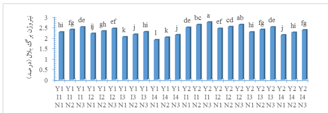
شکل ۳- اثر متقابل سال×دور آبیاری × سطوح مختلف کود نیتروژن برگ بلال

نتایج تجزیه واریانس داده‌های حاصل از آزمایش نشان داد که دور آبیاری، نیتروژن، پتاسیم، اثر متقابل دوگانه دور آبیاری×نیتروژن و اثر متقابل سه گانه سال×دور آبیاری×نیتروژن