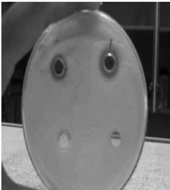
شکل ۳. اثر سوسپانسیون پروبیوتیکی و اسید های آلی با pH خنثی در مهار رشد اشریشیا کلی O157:H7 : اطراف چاهک های حاوی اسید آلی (دو چاهک پایین) در مقایسه با چاهک حاوی پروبیوتیک (دو چاهک بالا) رشد باکتری ممانعت نشده است.

کلی O157:H7 نمی تواند باشد (۱۵). به همین دلیل در این پژوهش ما نیز اثر آنتاگونیسمی اسیدهای آلی بر رشد باکتری اشریشیا کلی O157:H7 مورد بررسی قرار دادیم. نتایج نشان داد که اسیدهای آلی نمی توانند اثر قابل ملاحظه ای بر علیه این باکتری ایجاد نمایند. به نظر می رسد که عوامل دیگری مانند باکتریوسین ها، تولید و ترشح متابولیت های آلی و گلیکولپیدهایی با فعالیت بیولوژیک قوی در اثر مهار بر علیه این باکتری می تواند نقش تعیین کننده داشته باشد. اثر اسیدهای آلی و باکتریوسین ها و متابولیت های آلی تولید شده توسط پروبیوتیک ها علیه اشریشیا کلی O157:H7 روی رده سلولی ورو نیز بررسی شد و نتایج مشابهی حاصل گردید. متابولیت های آلی تولید شده حتی زمانی که pH محیط خنثی شد مانع تخریب رده سلولی ورو توسط اشریشیا کلی O157:H7 گردید (نتایج در این مقاله ذکر نشده است).