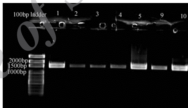
شکل ۳: الکتروفورز محصولات PCR جدایه های اشریشیا کلی پس از خالص سازی با استفاده از جفت پرایمرهای 16S 27f و 16S 1492R (ستون های ۱ تا ۱۰). Ladder = مارکر ۱۰۰ جفت بازی،

عمل الکتروفورز با استفاده از ژل آگارز ۱/۵ درصد انجام و پس از رنگ آمیزی با اتیديوم بروماید با دستگاه آشکار ساز UV Tech (Cambridge, United Kingdom) مشاهده گردید (شکل ۳).