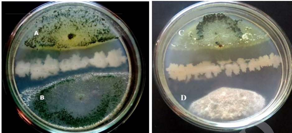
شکل ۱: فعالیت ضد قارچی لیزنی باسیلوس ماکروئیدس به روش کشت متقابل علیه. (A) ترکودرما وریه (B) تریکودرما هاریزانوم (C) تریکودرما اسپریلوم (D) فوزاریوم مونیلی فرم.

بحث باکتری های اندوفتیک تقریباً در بیشتر گیاهان مطالعه شده یافت شده اند (۱۸). گزارشات زیادی در رابطه با باکتری های اندوفتیک و گیاهانی که در آن ساکن اند مانند گوجه فرنگی، سیب زمینی، گندم، ذرت، پنبه، کلزا، برنج، سویا و غیره وجود دارد (۱۹ و ۲۰). گاهی این میکروارگانیسم ها می توانند به عنوان عوامل بیوکنترلی در برابر عوامل بیماری زا، بهبود باروری و توسعه گیاهان بدون هیچ آسیب محیطی عمل نمایند (۲۱). این میکروارگانیسم ها منبع جدیدی از ترکیبات فعال زیستی و شیمیایی با پتانسیل بالقوه برای بهره برداری در پزشکی، کشاورزی و در عرصه های صنعتی می باشند. به طوری که امروزه مطالعات زیادی بر روی آن ها انجام شده است (۲۲). بر همین اساس در تحقیق حاضر به جداسازی و شناسایی مولکولی باکتری های اندوفتیک و بررسی فعالیت ضد قارچی آن ها علیه گونه های تریکودرمایی به روش کشت متقابل پرداخته شد. در پژوهش حاضر لیزنی باسیلوس ماکروئیدس برای اولین بار به عنوان باکتری اندوفتیک از گیاه گندم گزارش شد. در حالی که در مطالعات مختلف لیزنی باسیلوس ماکروئیدس از کود گاو، ریزوسفر و گیاه پوسیده در آب جداسازی شده است (۲۳).