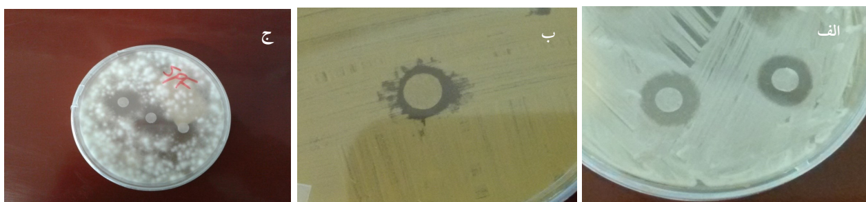
شکل ۱: نتایج ارزیابی خاصیت ضدقارچی عصاره گیاه رزماری در برابر قارچ های مورد بررسی. (الف) هاله شفاف عدم رشد قارچ کاندیدا آلبیکنس در اطراف دیسک رزماری، (ب) هاله شفاف عدم رشد قارچ آسپرژیلوس فلاووس ، (ج) هاله شفاف عدم رشد قارچ درماتوفیتی.

در این معادله E معرف کارایی PCR و Ct شماره چرخه ای است که در آن منحنی تغییرات میزان فلورسانس هر نمونه خط آستانه را قطع می کند. با توجه به مطالب یاد شده برای آنالیز کمی میزان بیان ژن aflR بین لوله های دارای رشد آسپرژیلوس فلاووس در آزمون MIC ابتدا میزان کارایی PCR برای ژن aflR و نیز ژن تا-اکتین به عنوان رفرنس، با استفاده از منحنی استاندارد اختصاصی برای هر ژن تعیین گردید. سپس میانگین Ct اختصاصی هر یک از قطعات ( aflR و ژن تا-اکتین ) در لوله های واجد رشد آسپرژیلوس فلاووس در تست MIC به دست آورده شد و در معادله Pfaffl قرار داده شد. به این ترتیب میزان تغییر بیان ژن مورد نظر در گروه اصلی و گروه کنترل به دست آورده شد (۳۱-۲۹).