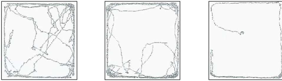
(الف) (ب) (ج)

تصویر شماره ۱: نمونه ای از الگوهای حرکتی ثبت شده در دستگاه پایش فعالیت حرکتی (MAM)، ویژه موش های نر سالم دریافت کننده سالیین (الف)، دریافت کننده مقدار ۳۰ mg/kg بابونه (ب) و دریافت کننده مقدار ۵۰ mg/kg عصاره بابونه (ج).