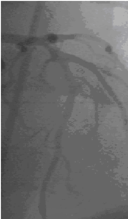
شکل شماره ۴: دومین آنژیوگرافی بیمار