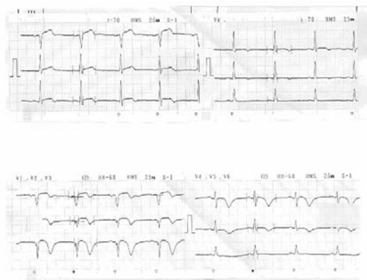
شکل شماره ۱: نوار قلب در زمان بستری اولیه