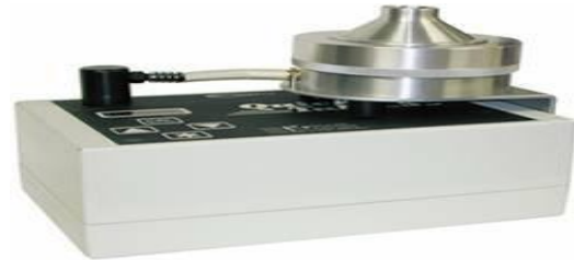
تصویر شماره ۱: دستگاه نمونه بردار Quick Take 30

داخل دستگاه قرار گرفت. دبی جریان نمونه‌برداری ۲۸/۳ L/min و مدت زمان نمونه‌برداری پنج دقیقه برای نمونه‌برداری هوای واحدهای مختلف هر دانشکده در نظر گرفته شد.