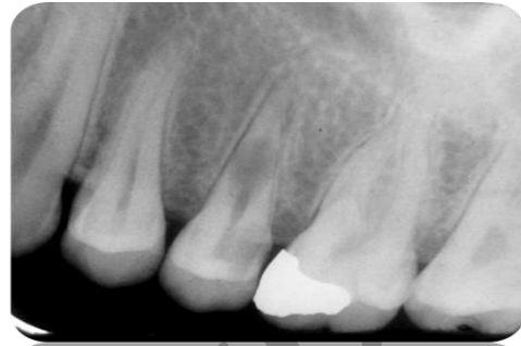
تصویر شماره ۱: رادیوگرافی تشخیصی

کانال شد که با خونریزی شدید کانال همراه بود که با توجه به تشخیص تحلیل، قابل انتظار بود. رادیوگرافی تعیین طول تهیه شد (تصویر شماره ۲).