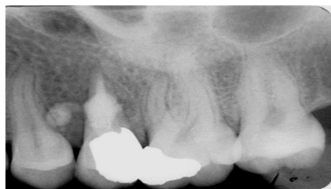
تصویر شماره ۶: دو سال پس از درمان