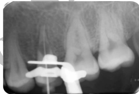
تصویر شماره ۲: رادیوگرافی تعیین طول

برای شستشوی از هیپوکلریت ۵/۲۵ درصد و نرمال سالین (داروپخش، تهران، ایران) به طور متناوب استفاده شد. آماده‌سازی کانال با استفاده از فایل دستی استنلس استیل به طریقه step back تا شماره ISO ۶۰ انجام شد و در انتها گیتز گیلدن (Dentsply Maillefer, Ballaigues, Switzerland) شماره‌های ۲ و ۳ استفاده شد. مرتباً از شستشودهنده استفاده شد. اما خونریزی شدید به هیچ عنوان قابل کنترل نبود. جهت کنترل خونریزی پودر کلسیم هیدروکساید (گلچای، تهران، ایران) به داخل کانال گذاشته شد که توسط خونریزی کانال شسته شد. به ناچار مجدداً کلسیم هیدروکساید به صورت پودر داخل کانال فشرده شد و حفره دسترسی توسط cavisol (گلچای، تهران، ایران) مسدود شد. به بیمار توصیه شد که ده روز بعد جهت