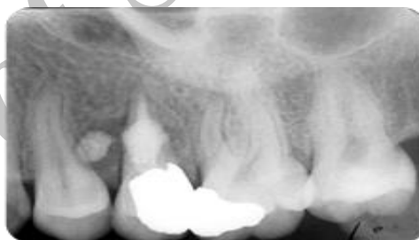
تصویر شماره ۵: شش ماه پس از درمان