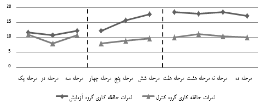
نمودار شماره ۱: حافظه کاری گروه آزمایش و کنترل در ۱۰ مرحله

نمودارهای شماره ۱، ۲، ۳ و ۴، سطح عملکرد حافظه کاری و مؤلفه های خواندن (توانایی خواندن، سرعت خواندن و درک مطلب) گروه آزمایش و گواه در مراحل خط پایه، درمان، پس از درمان و پیگیری را نشان می دهد. همان طور که نمودارها نشان می دهند، آزمودنی های گروه آزمایش در مقایسه با خط پایه و هم چنین گروه کنترل در حافظه کاری و مؤلفه های خواندن در مرحله درمان و پیگیری، پیشرفت نشان داده اند.