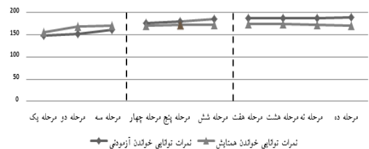
نمودار شماره ۲: توانایی خواندن گروه آزمایش و کنترل در ۱۰ مرحله