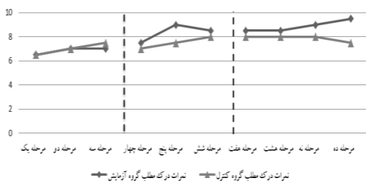
نمودار شماره ۴: درک مطلب گروه آزمایش و کنترل در ۱۰ مرحله