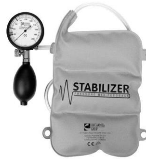
تصویر شماره ۲: دستگاه بیوفیدبک فشاری

هیپ در این نقطه توسط گونیامتر بر حسب درجه اندازه گیری می‌شد. چارت امتیازدهی قدرت در این آزمون در جدول شماره ۱ نشان داده شده است (۱۹). پیش از اجرای سه آزمون اصلی، فرد می‌توانست دو مرتبه نحوه اجرای آزمون را تمرین نماید. بهترین نمره از بین سه تلاش فرد در اجرای آزمون به عنوان نمره آزمودنی ثبت می‌شد. پیش از اجرای آزمون، توضیحات شفاهی و بصری برای کلیه آزمودنی‌ها توسط آزمونگر داده شد.