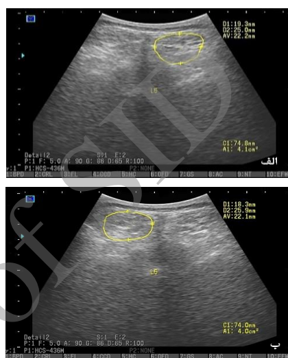
تصویر شماره ۳: تصویر سونوگرافی عضله مولتی فیدوس در سطح L5 (الف: سمت راست؛ ب: سمت چپ)

نیز فاشیای سطحی عضله لبه فوقانی و فاشیای جدا کننده عضله لانجیسیموس با مولتی فیدوس تعریف شدند (تصویر شماره ۳). روایی و پایایی این روش در مطالعات قبلی مورد بررسی قرار گرفته است که از سطح قابل قبولی برخوردار است (۲۶،۲۵). اندازه گیری متغیرهای مورد نظر توسط یک ارزیاب ماهر انجام گرفت که نسبت به گروه بندی آزمودنی ها اطلاعی نداشت.