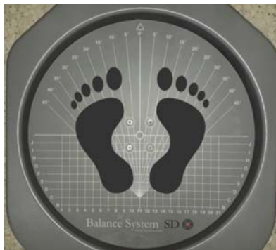
تصویر شماره ۱: محل قرارگیری پاها بر روی بایودکس

به منظور اندازه گیری نوسانات قامتی آزمودنی‌ها در تحقیق حاضر از دستگاه تعادلی Biodex (ICC \geq 0.79 ) استفاده استفاده شد (۲۶). صفحه‌ی این دستگاه شامل نواحی چهارگانه برای استقرار پنجه پای راست در ربع اول، پنجه پای چپ در ربع دوم، پاشنه پای چپ در ربع سوم و پاشنه پای راست در ربع چهارم می‌باشد (۲۲) (تصویر شماره ۱).