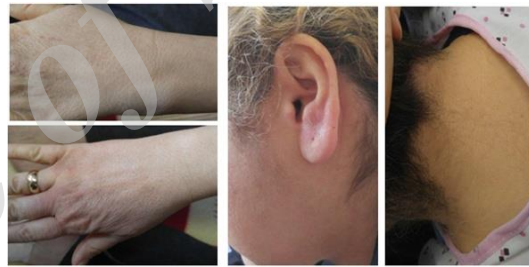
تصویر شماره ۳: از بین رفتن ضایعات بعد از درمان

توجه به عوارض کمتر و موفقیت موارد قبلی گزارش شده و هم‌چنین اثربخشی طولانی‌تر - (۴۰۰ mg/kg/day) در ۵ روز متوالی، همراه) شروع شد، پردنیزولون با دوز 50mg/day نیز برای بیمار شروع شد و سپس دوز دارو پس از مدت ۴ هفته به تدریج کاهش داده شد. آزاتیوپرین 50mg سه بار در روز و فولیک اسید 1mg روزانه برای بیمار تجویز شد. علائم بیمار پس از یک ماه از شروع درمان بهبود نسبی پیدا کرد. بعد از درمان به مدت یک سال، علائم بیمار شامل ضایعات پوستی، دیسفاژی و ضعف عضلانی به‌طور کامل از بین رفت (تصویر شماره ۳). در حال حاضر بیمار تحت درمان پردنیزولون (low dose) و سیکلوفسفاماید می‌باشد و علائم بیمار در این مدت عود نداشته است.