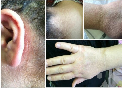
تصویر شماره ۱: ضایعات پوستی قبل از درمان

درمان با قرص رواکوتان (ایزوترتینوئین) ۲۰ میلی گرم دوبار در روز، متوترکسات ۲۵ میلی گرم به صورت هفتگی و فولیک اسید ۱ میلی گرم روزانه بر اساس تشخیص اسکرومیگرمادما برای بیمار شروع شد. به دنبال یک سال درمان، بیمار از مجموعه‌ای از علائم عضلانی-اسکلتی، گوارشی و ادراری شکایت داشت که این علائم شامل: ضعف در حین بالا رفتن از پله‌ها یا در حین برخاستن از روی صندلی، احساس خستگی و آرتراژی در کتف‌ها و زانوها و مفاصل MCP، PIP و DIP، رگورگیتاسیون، سختی در بلع مواد جامد و تکرر و سوزش ادرار بود. علائم تب یا کاهش وزن وجود نداشت.