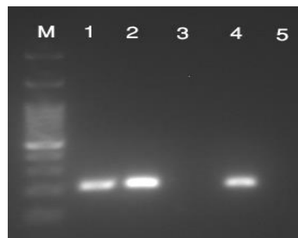
تصویر شماره ۱: تصویر ژل الکتروفورز مربوط به ژن sea استافیلوکوکوس اورئوس M: اندازه نشانگر DNA (1000 bp)، ۱ و ۲: سویه های حامل ژن Sea (اندازه محصول 210 bp)، ۳: سویه فاقد ژن Sea ، ۴: کنترل مثبت، ۵: کنترل منفی

نتایج مربوط به تکثیر ژن های انتروتوکسین های A و B به روش PCR، در تصاویر شماره ۱ و ۲ نشان داده شده است.