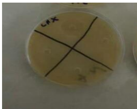
تصویر شماره ۲: وجود هاله عدم رشد میکروبی در محیط کشت باکتری اکتینومیسس نیوزلندی در مجاورت کلرگزیدین ۰/۲ درصد

اما در مورد کلرگزیدین این قطر به ترتیب ۱/۸، ۲، ۱/۹، ۱/۹ میلی متر برای کانیدیدا آلبيکانس و ۲، ۲، ۱/۹ میلی متر برای اکتینومیسس نیوزلندی و ۱، ۱/۹، ۱/۸، ۱ میلی متر برای استافیلوکوک اورئوس در آزمایش اصلی و سه بار تکرار بعدی آزمایش اندازه گیری شد (تصویر شماره ۲). بنابراین می توان نتیجه گرفت فنی توئین موضعی بر میکروارگانسیم های استافیلوکوک اورئوس، اکتینومیسس نیوزلندی و کانیدیدا آلبيکانس اثر ضد میکروبی یا ضد قارچی نشان نداد.