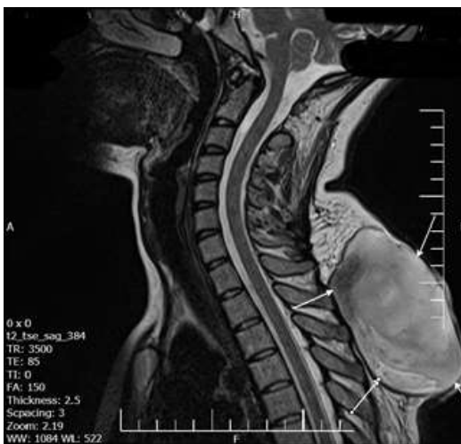
تصویر شماره ۲: ضایعه هتروژن با حاشیه مشخص در بافت subcutaneous با گسترش تا supraspinatus ligament در محاذات C7-T5

در MRI و CT انجام شده قبل از جراحی، توده نسج نرم در ابعاد ۱۴۰*۱۲۶*۱۱۴ میلی متر مشاهده شد و همان طور که در تصاویر مشخص است توده حدود مشخص داشته و به مهره ها و کانال نخاعی دست اندازی نداشت (تصویر شماره ۱).