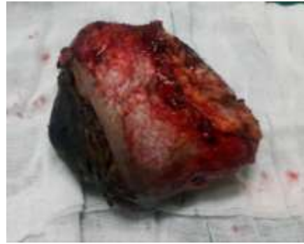
تصویر شماره ۳: تومور بعد از خارج سازی

بدینوسیله نویسندگان از پرسنل محترم بیمارستان ولی عصر (عج) اراک، کمال تشکر و قدردانی را می‌نماید.