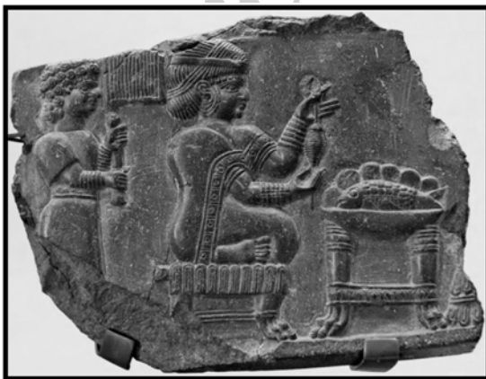
تصویر ۲) نقش برجسته ایلامی ◀