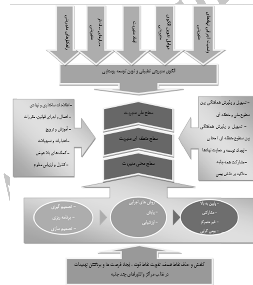
نگاره ۲. الگوی پیشنهادی مدیریت توسعه روستایی

تحقیق انجام‌گرفته، باید الگوی مدیریت بر پایه دانش و آگاهی درباره وضعیت اجرایی نهادهای مدیریتی، ابعاد مدیریتی، معیارهای ساختاری و راهکارهای مدیریتی صورت گیرد. ضمن اینکه رعایت عواملی چون اصلاحات ساختاری و نهادی، اعمال و اجرای قوانین، مقررات، آموزش و ترویج، اعتبارات و تسهیلات، کمک‌های بلاعوض، کنترل و ارزیابی مداوم می‌تواند در هر کدام از سطوح ملی، منطقه‌ای و محلی باعث ایجاد تسهیل و پذیرش هماهنگی بین سطوح ملی و