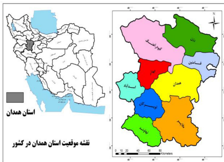
نگاره ۱. موقعیت استان همدان در کشور

استان همدان در گستره‌ای به مساحت ۱۹۴۹۳ کیلومترمربع، در غرب ایران بین ۳۳ درجه و ۵۹ دقیقه تا ۳۵ درجه و ۴۸ دقیقه عرض شمالی و ۴۷ درجه و ۳۴ دقیقه تا ۴۹ درجه و ۳۶ دقیقه طول شرقی از نصف‌النهار گرینویچ قرار گرفته است. این استان از شمال به زنجان و قزوین، از جنوب به لرستان، از شرق به مرکزی و از غرب به کرمانشاه کردستان محدود است. جمعیت استان در سال ۱۳۹۰ برابر ۱۷۵۸۲۶۸ نفر است که ۵۹٫۲ درصد آن شهرنشین و ۴۰٫۸ درصد آن روستائین است (مرکز آمار ایران، ۱۳۹۰).