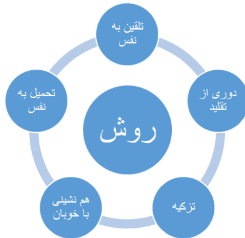
شکل ۱. روشن