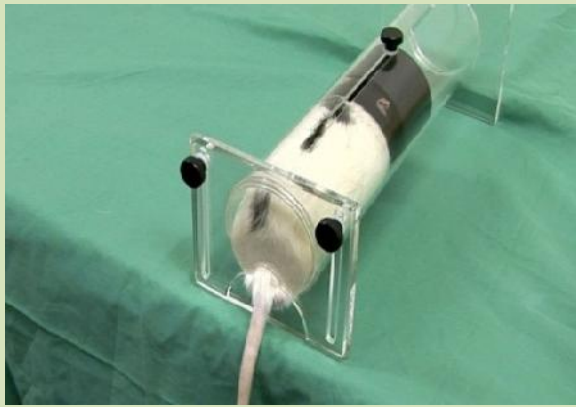
شکل ۲- نحوه ایجاد استرس در موش توسط دستگاه نگهدارنده