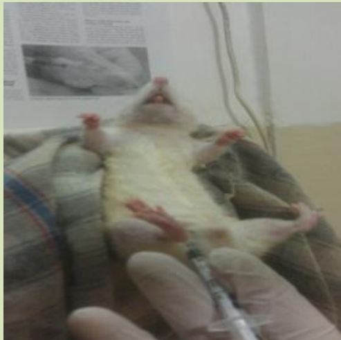
شکل ۳- بیهوش کردن حیوان با تزریق صفاقی