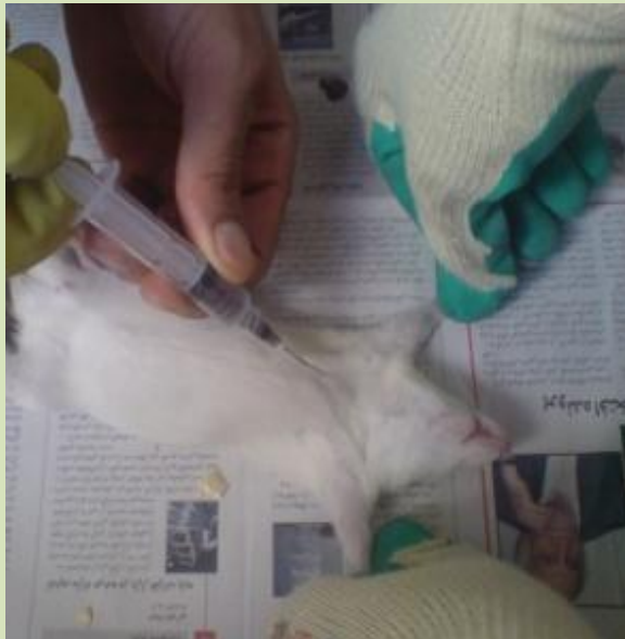
شکل ۴- خونگیری از قلب