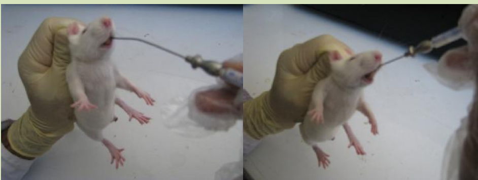
شکل ۱- نحوه گاوآژ دهانی موش‌ها

برای ایجاد استرس بی حرکتی حاد، رت‌ها فقط یک بار و به مدت ۲ h در دستگاه نگهدارنده قرار داده شدند. پس از پایان چهار هفته و قرار دادن موش‌ها در وضعیت استرس‌های مزمن و حاد در نهایت همه موش‌ها با تزریق صفاقی ترکیب شیمیایی کتامین (به میزان ۷۵mg به ازای هر ۱۰۰۰g وزن موش) و زایلوزین (به میزان ۱۰mg به ازای هر ۱۰۰۰g وزن موش)