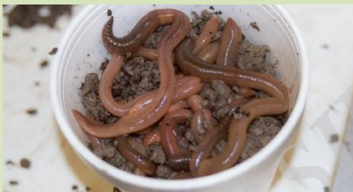
شکل ۱- کرم خاکی پرورش یافته در ظرف های مخصوص در تیمار شاهد

تعداد کرم های خاکی در همه تیمارها کمتر از تیمار شاهد است. کمترین تعداد کرم خاکی در تیمار اسید سولفوریک با تعداد ۱۸ کرم دیده شد. در تیمار خاک با اسید سیتریک نیز تعداد کرم های خاکی کاهش یافت. بیشترین وزن کل کرم ها نیز در تیمار با اسید