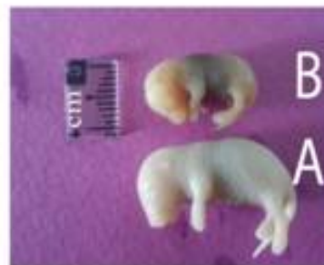
(A) و جنین گروه تجربی III(B).