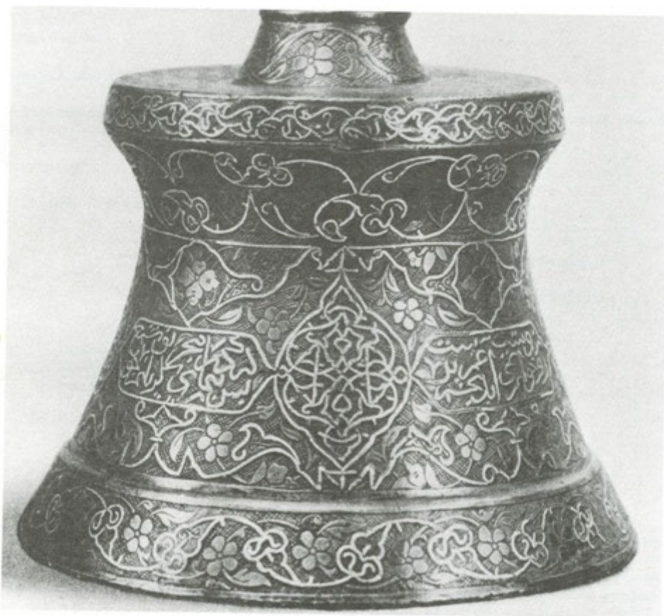
تصویر شماره ۲ - شمعدان برنجی