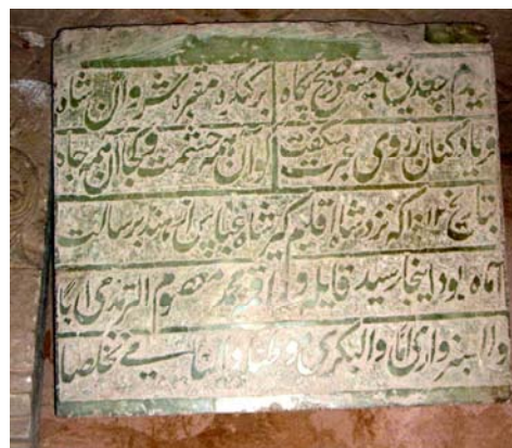
تصویر شماره ۱: کتیبه سنگی میر معصوم بگری.