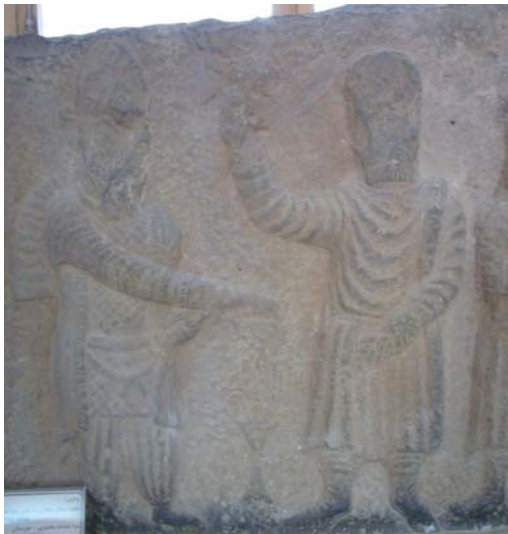
تصویر شماره ۳- قسمتی از تخته سنگی که مراسم اهداء نذورات به آتشدان را نشان می‌دهد، بردنشانده.

می‌توان در نوشته‌های نویسندگان یونانی و رومی مشاهده نمود. بنا بر برخی منابع، آتش جاودان را در شهر آساک نگهداری می‌کردند (کالج، ۱۳۸۵: ۸۹). صدها نقش برجسته در پالمیر و چند نقاشی در دورا اوراپوس با همین مضامین آمده است که آنها را به ۵۰ تا ۱۰۰ میلادی نسبت داده‌اند (کالج، ۱۳۸۵: ۱۴۴).