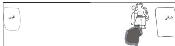
تصویر شماره ۱- موقعیت استودان‌ها و نقش برجسته نسبت به یکدیگر.

برخورد با استخوان‌ها، ضخامت قسمت ورودی را تا ۵۰ سانتی‌متر افزایش داده‌اند.