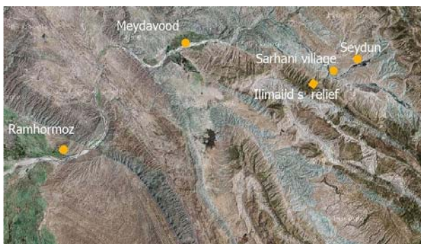
نقشه ۱- موقعیت جغرافیایی نقش برجسته سرحانی.

داشته و دسترسی به آنها تنها از طریق جاده‌ای مالرو که از جنوب روستا به سمت مزارع مشرف بر روستا ادامه می‌یابد؛ امکانپذیر است. این جاده پس از طی مسیری پر پیچ و خم و پس از گذر از بلندی به نام گردکی به سمت دره دری جوک سرازیر می‌شود که رودخانه دایمی رونو در آن جریان دارد. نقش برجسته و استودان سرحانی مشرف بر رودخانه قرار گرفته‌اند. مختصات جغرافیایی نقش برجسته "N:31° 21' 963" و "E:049° 57' 986" و ارتفاع آن از سطح آب‌های آزاد ۸۰۴ متر است (نقشه ۱).