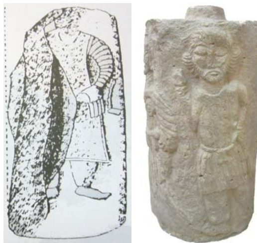
تصویر شماره ۴- راست) پایه ستون بدست آمده از معبد بزرگ مسجد سلیمان، موزه شوش (عکس از عرب-چپ) میان ستون (رضایی‌نیا، ۱۳۸۴: ۳۳۸).

داشته و دست دیگر را به کمر زده نیز در اغلب نقوش الیماید دیده می‌شود. این حالت در خونگ نوروزی (فرد وسطی و اولین فرد سمت راست)، در تنگ بتان شیمبار، در تنگ سروک II (افراد صحنه میانی روی وجه شمال غربی) (واندنبرگ و شیپمن، ۱۳۸۶: ۱۰۵) و در مسجد سلیمان (تصویر شماره ۴) دیده می‌شود.