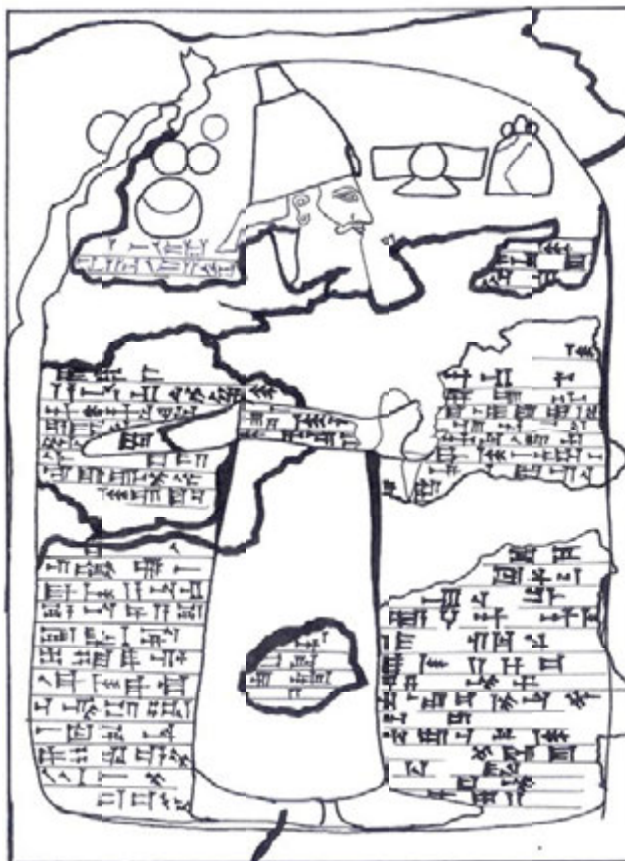
شکل ۲: طرحی از نقش برجسته اشکفت گل گل (برگرفته از مظاهری، ۱۳۸۵: ۷۴).