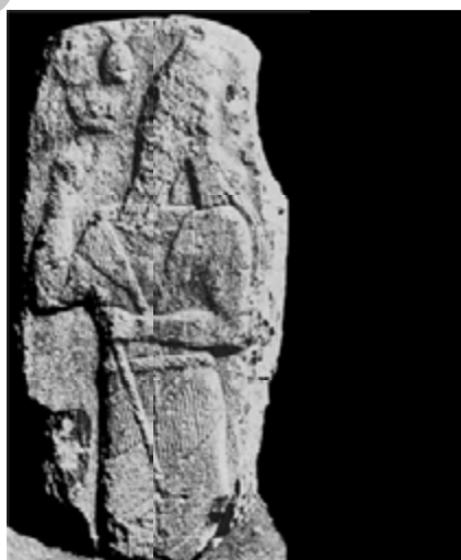
تصویر ۱: سنگ یادمان پیروزی سارگن دوم در نجف آباد اسد آباد (بر گرفته از: Levine, 1971: 43).