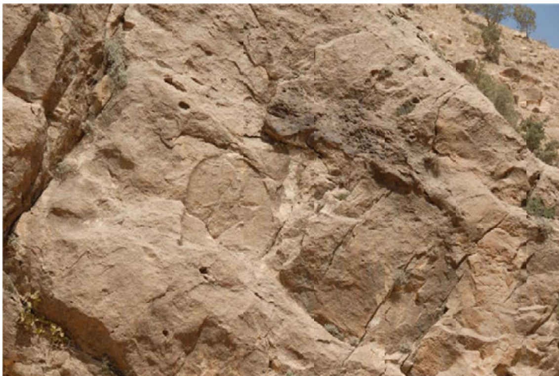
تصویر ۵: نقش برجسته آشوری میشخاص