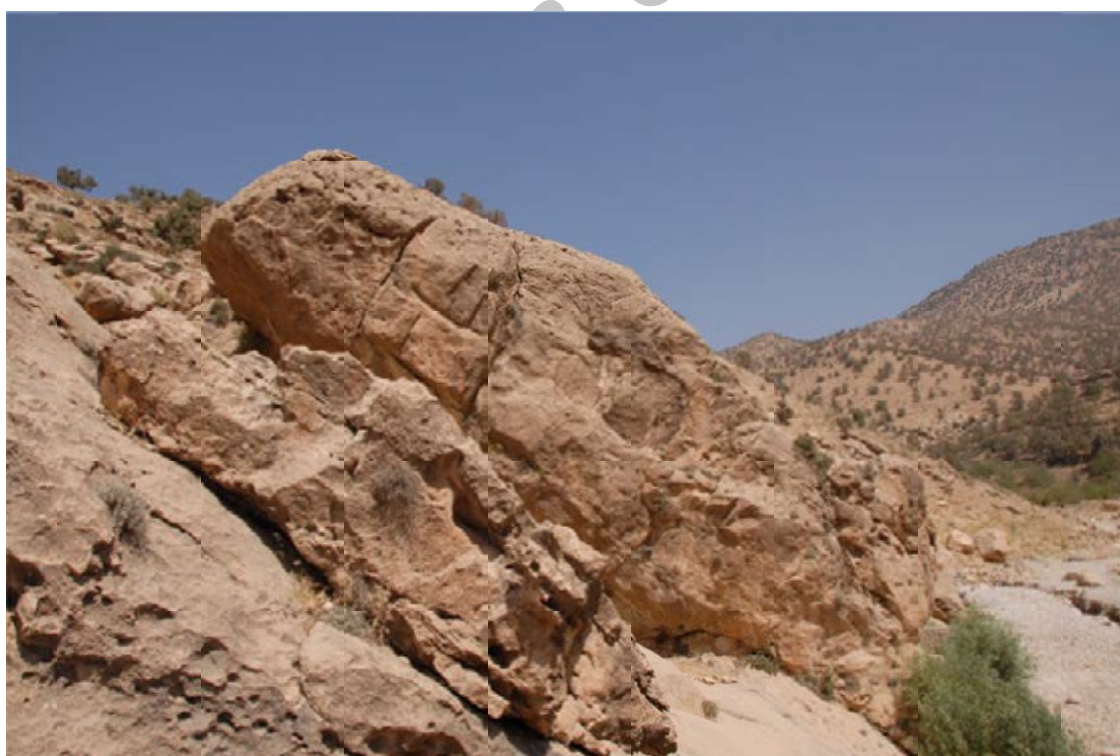
تصویر ۴: موقعیت نقش برجسته آشوری میشخاص بر روی صخره واقع در حاشیه رودخانه میشخاص