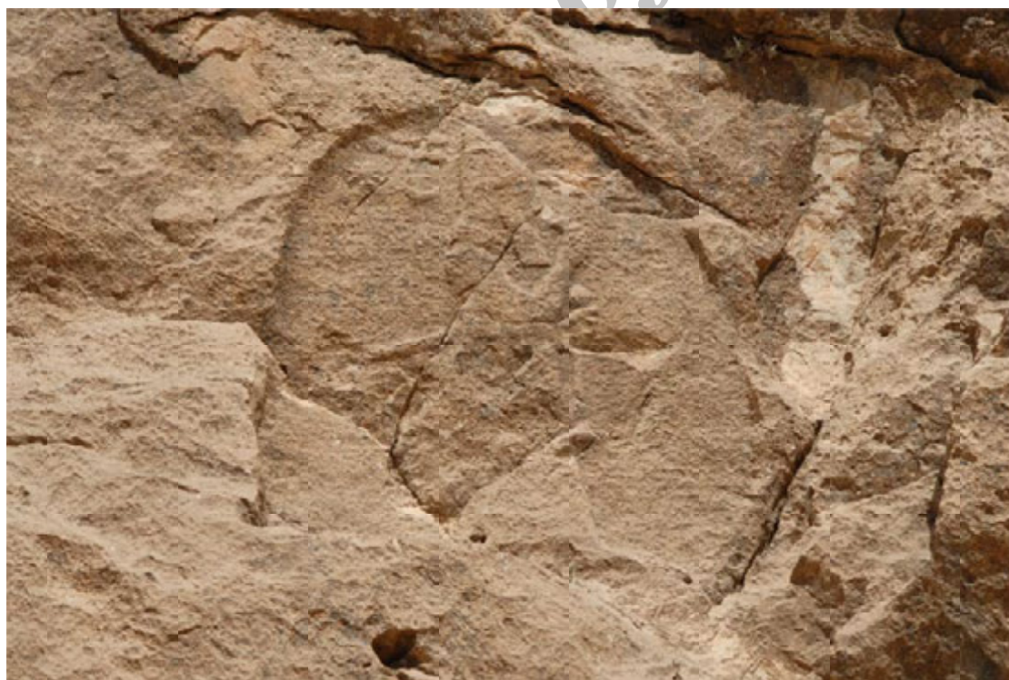
تصویر ۶: نمایی نزدیک از نقش برجسته آشوری میشخاص