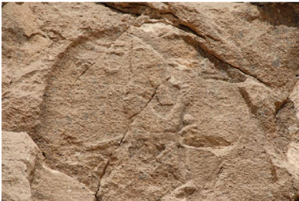
تصویر ۷: جزئیات نقش برجسته آشوری میشخاص