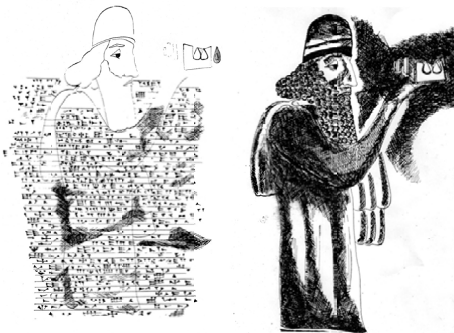
شکل ۱: طرحی از نقش برجسته و کتیبه سارگون دوم در تنگی ور (برگرفته از سرفراز، ۱۳۴۷: شکل های ۳ و ۴).