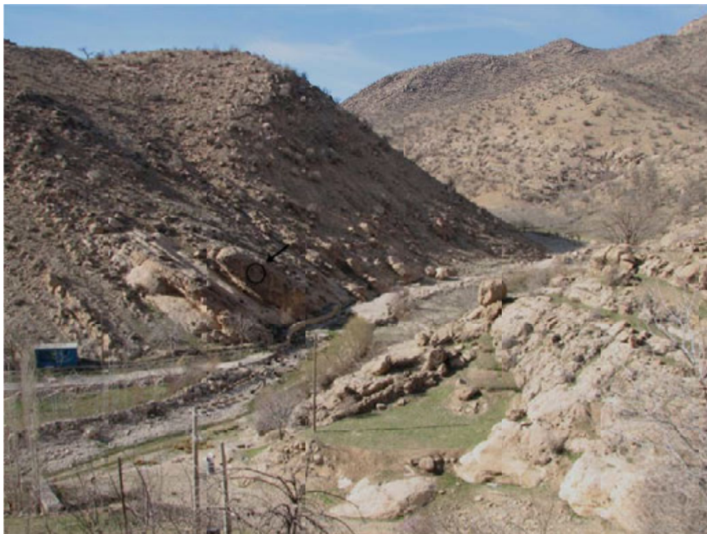
تصویر ۳: دورنمایی از وضعیت فرارگیری نقش برجسته میشخاص نسبت به اطراف.