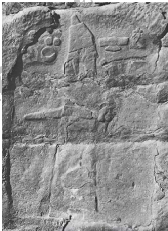
تصویر ۲: تصویری از نقش برجسته اشکفت گل گل (برگرفته از: Vanden Berghe, 1973: PL. XIII).