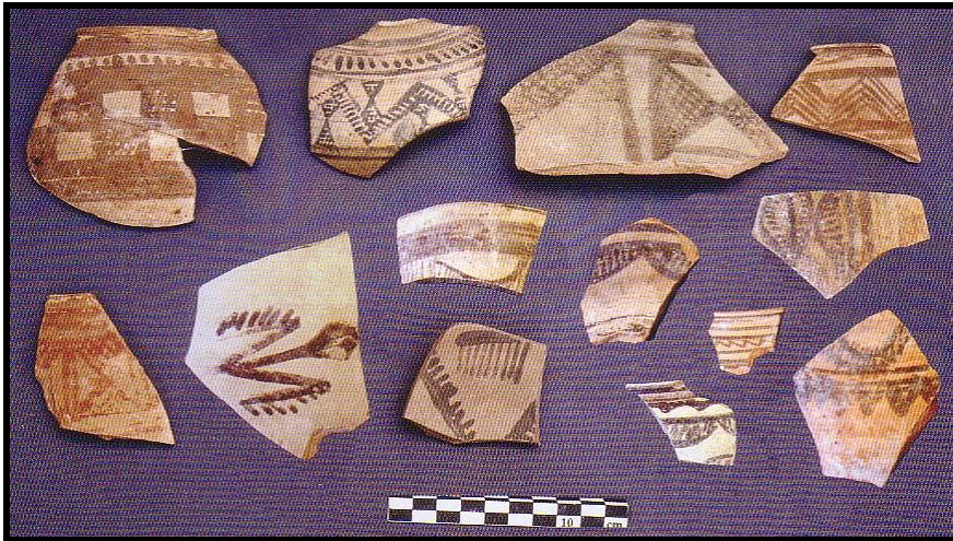
تصویر ۴: سفال‌های شاخص تپه کنارصندل جنوبی (برگرفته از Madjidzade, 2008).