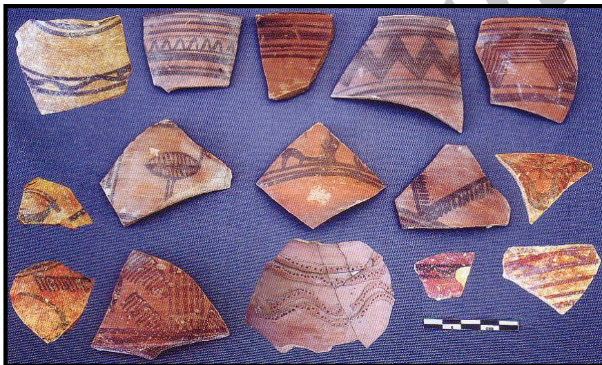
تصویر ۵: سفال‌های شاخص تپه کنارصندل جنوبی (برگرفته از Madjidzade, 2008).