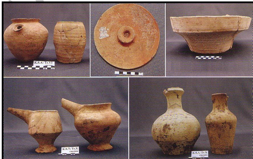
تصویر ۶: سفال‌های شاخص تپه کنارصندل شمالی (برگرفته از Madjidzade, 2008).