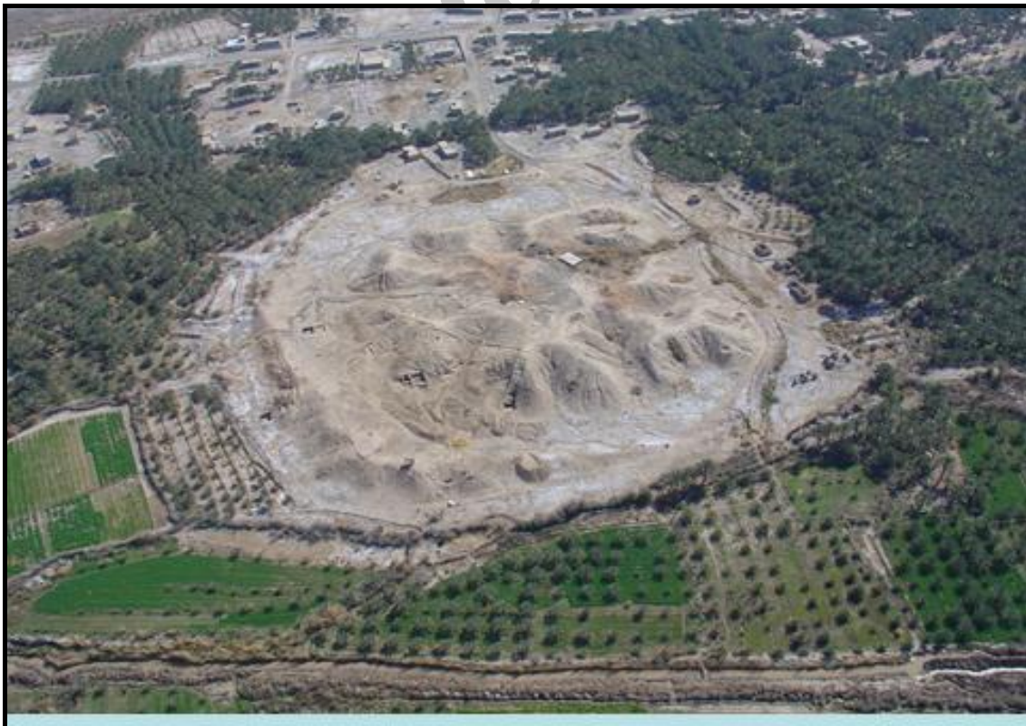
تصویر ۳: عکس هوایی تپه کنار صندل شمالی.