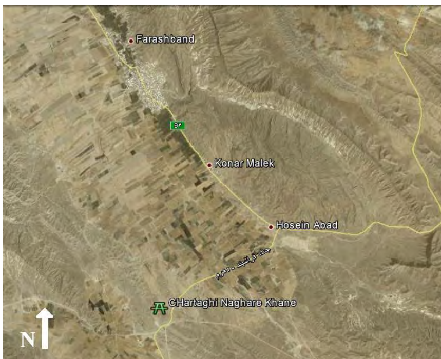
تصویر ۲: نحوه دسترسی و موقعیت قرارگیری چهارطاقی نسبت به شهر فراشبند.