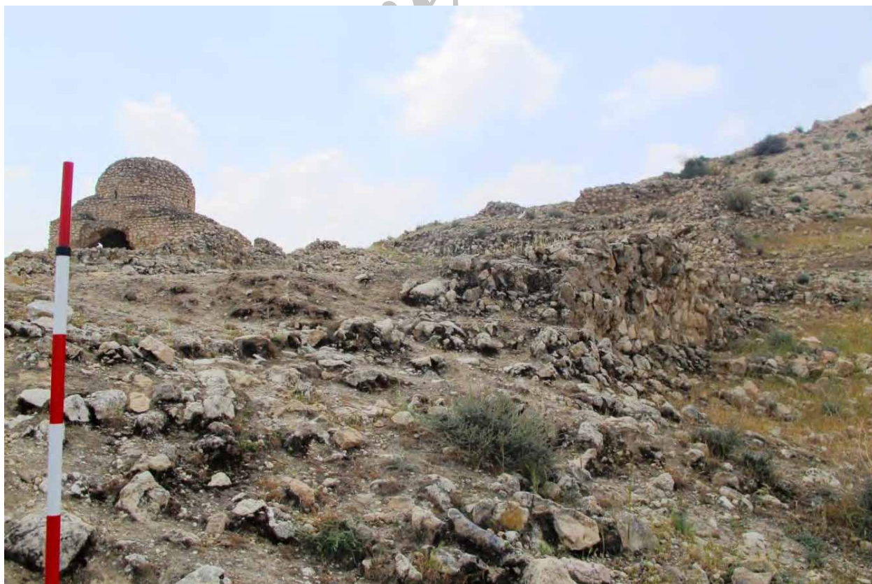
تصویر ۵: دیوارهای حصار شمالی، مجاور به طبقه نخست.