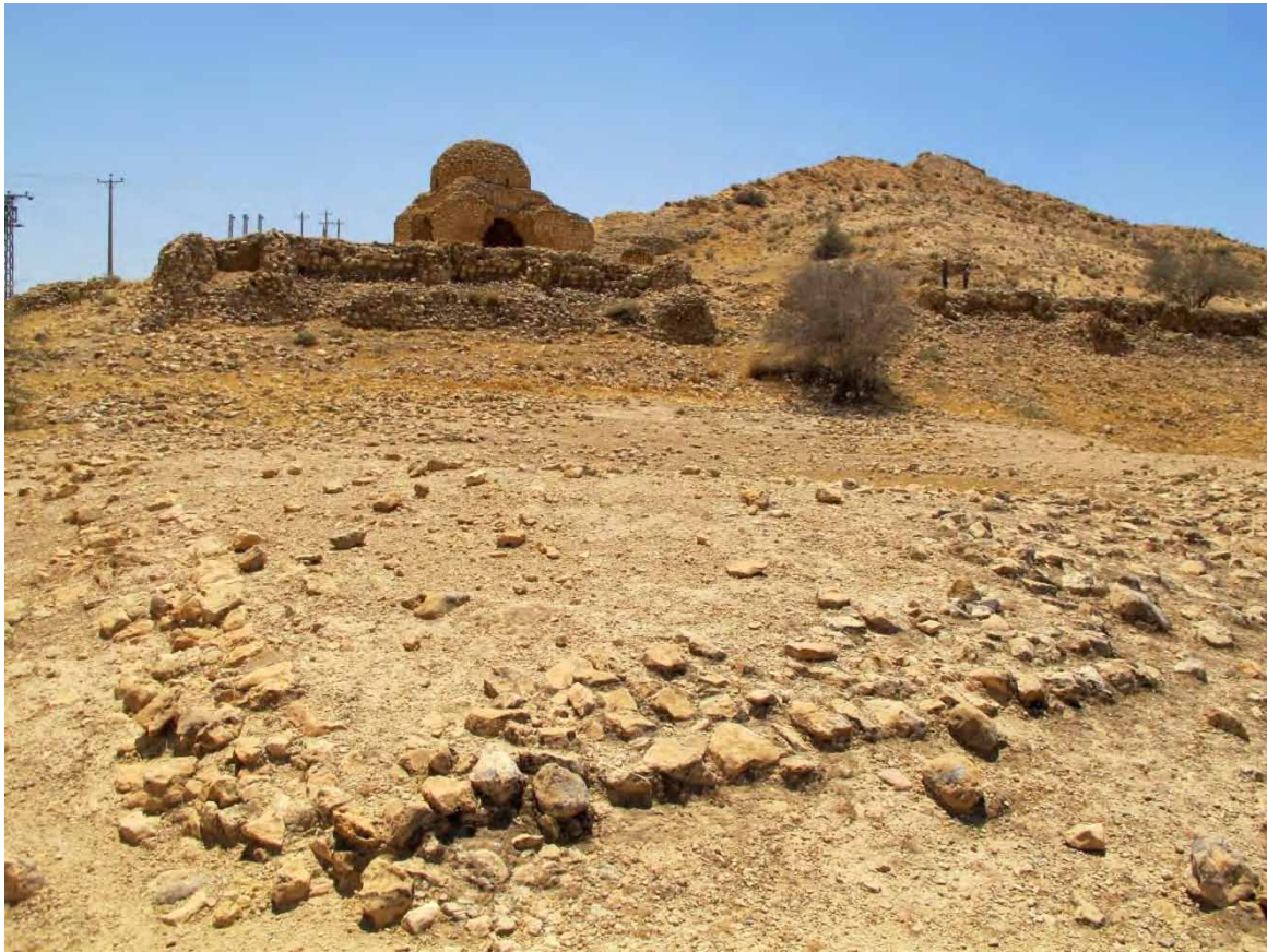
تصویر ۶: آثار رج دیوارهای به جا مانده در طبقه نخست.