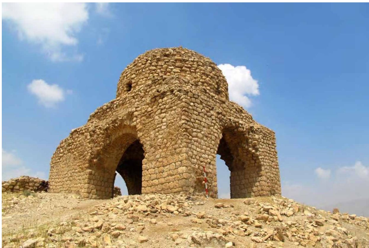
تصویر ۴: طبقه چهارم و چهارطاقی از سمت جنوب شرقی.