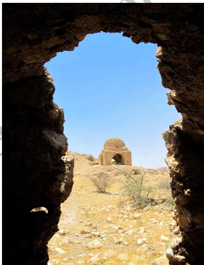
تصویر ۳: چهارطاقی نقاره‌خانه با دیدی از داخل اتاق‌های طبقه دوم.