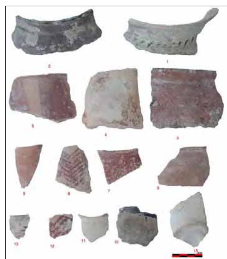
تصویر ۱۰: تصویری بخشی از سفال‌های بدست آمده از بررسی سطحی غار سمنگان.