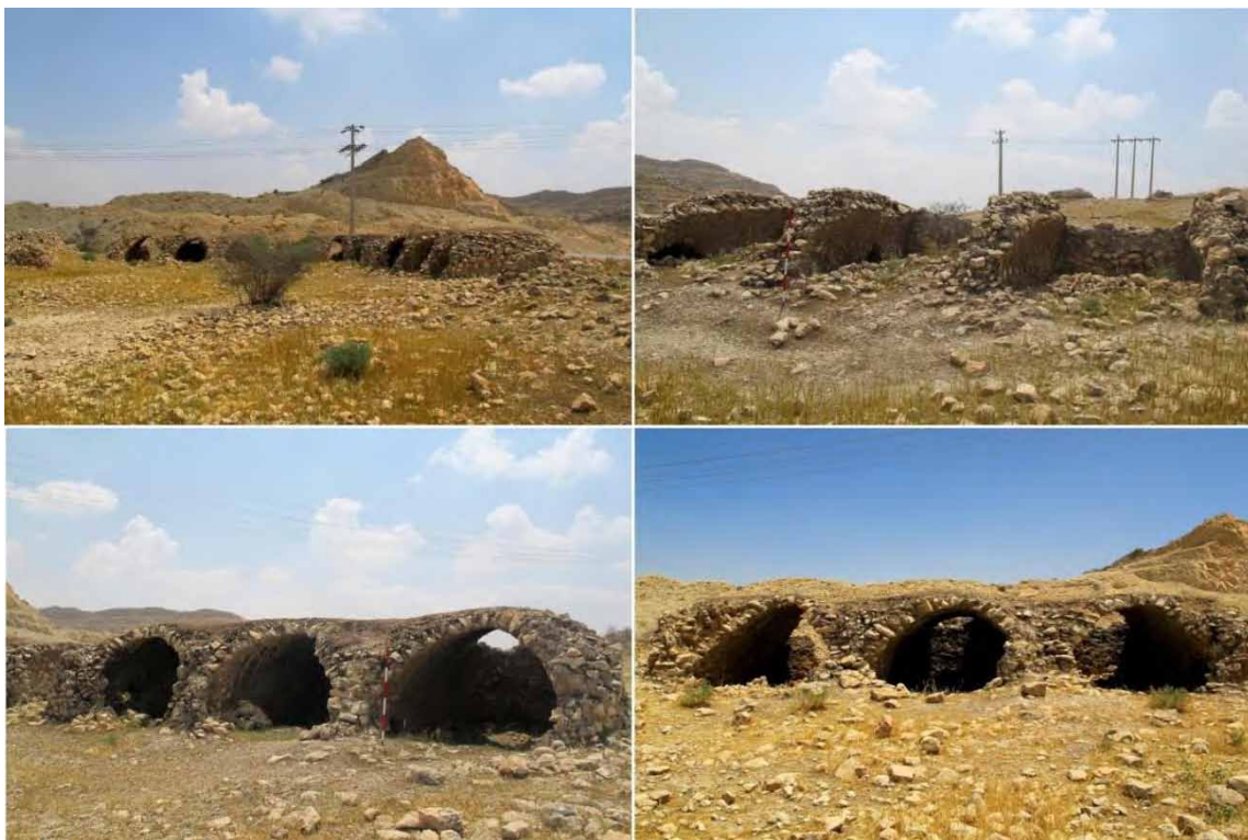
تصویر ۱۵: بخش‌هایی از اتاق‌های نیمه‌سالم در طبقه دوم.