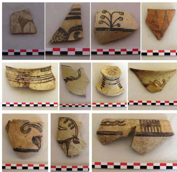
تصویر ۱۲: نمونه‌هایی از سفال‌های دوره مس سنگی جدید تپه سگزر آباد بدست آمده از کاوش‌های سال ۱۳۸۸.