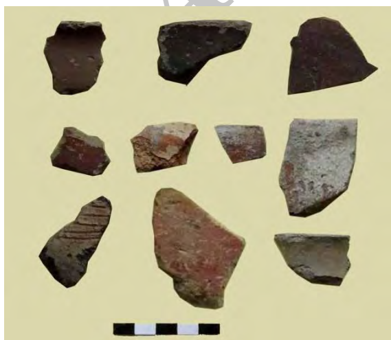
تصویر ۵: سفال‌های ساده و سفال نقش‌کنده دالما.