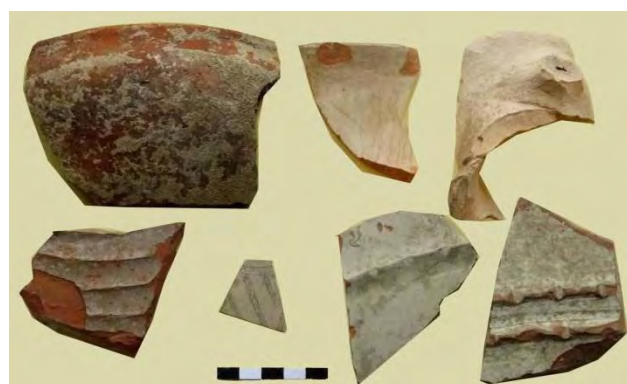
تصویر ۹: سفال نارنجی و نخودی با سفال نقش‌کنده عصر آهن.