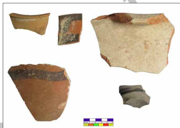
تصویر ۳: سفال‌های منتخب از محوطه دومنه.