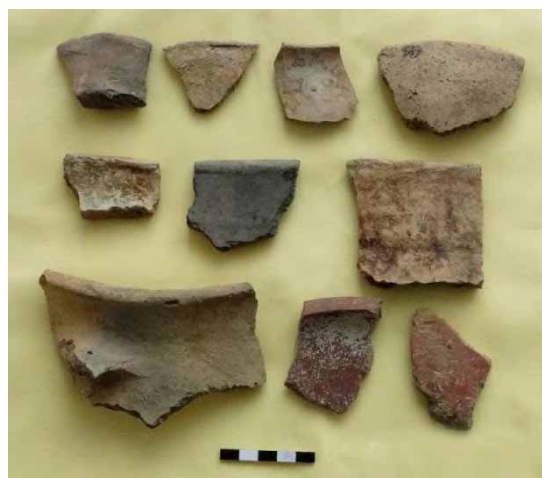
تصویر ۶: نمونه‌هایی از سفال‌های دوره مفرغ منطقه.