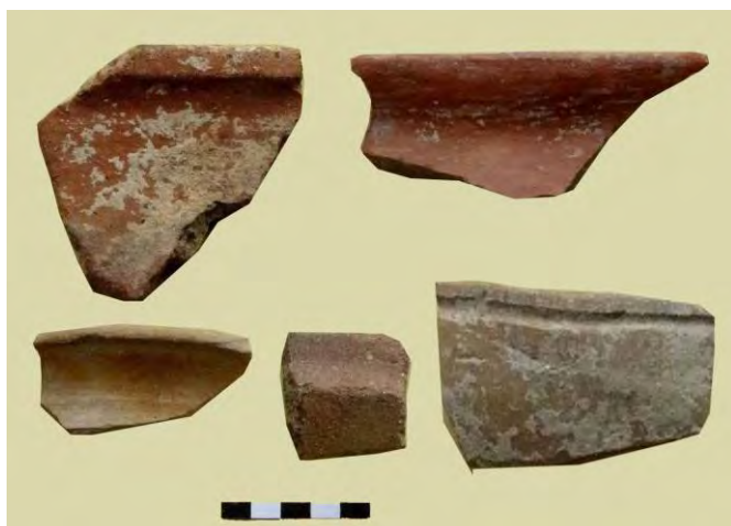
تصویر ۷: سفال‌های قرمز و قهوه‌ای عصر آهن.