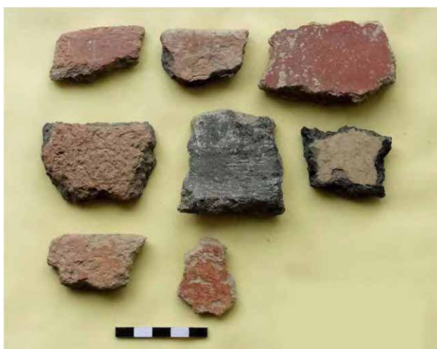
تصویر ۴: نمونه‌ای از سفال‌های ساده دالما.