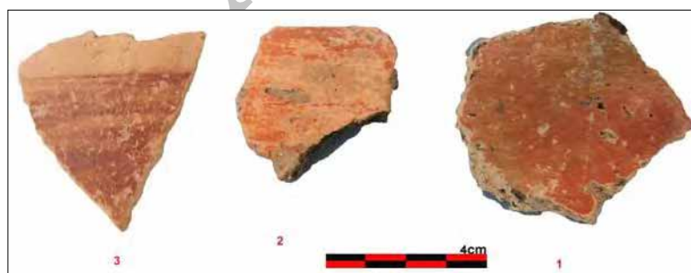
تصویر ۱۱: تصویری از سفال‌های بدست آمده از غار کولان گورا.