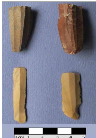
تصویر ۱: سنگ مادر فشنگی، محوطه پیدزرد.