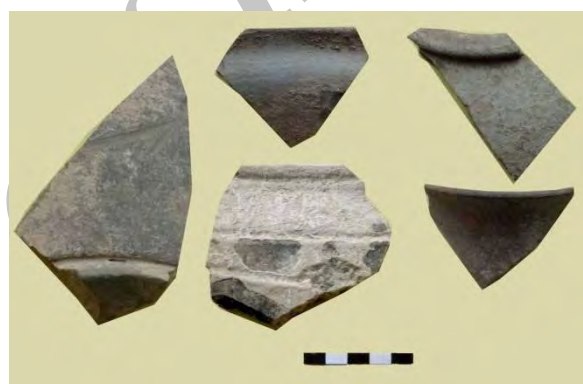
تصویر ۸: نمونه‌ای از سفال‌های خاکستری عصر آهن.