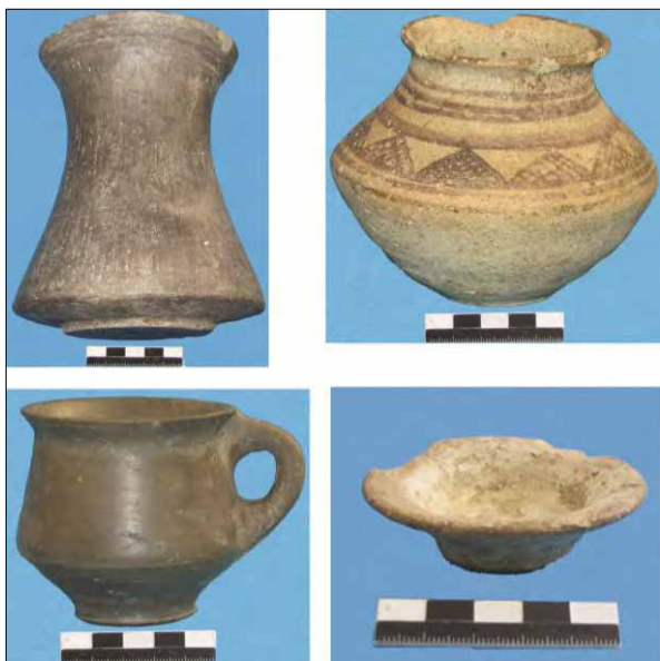
تصویر ۱۳: سفال‌های بدست آمده از قلعه تپه در زمان تسطیح محوطه.