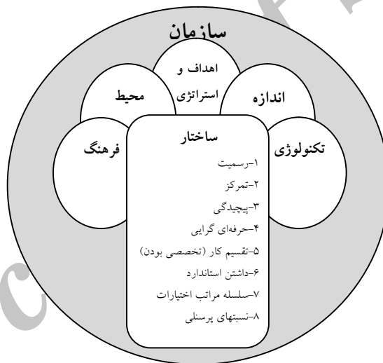
شکل ۲: ابعاد سازمان (دفت، ۱۳۸۶، ۱۹)

این بخش در واقع بیان‌کننده یافته‌های تحقیق می‌باشد. به اعتقاد کارشناسان یکی از گام‌ها برای درک سازمان توجه به ابعادهای ساختاری و محتوایی سازمان است. ابعاد ساختاری (Structural dimension) بیان‌کننده ویژگی‌های درونی یک سازمان هستند. آنها مبنایی به دست می‌دهند که می‌توان بدان وسیله سازمان‌ها را اندازه‌گیری و با هم مقایسه کرد. ابعاد محتوایی (Contextual dimension) معرف کل سازمان هستند؛ مثل اندازه یا بزرگی سازمان. این ابعاد معرف جایگاه سازمان هستند و بر ابعاد ساختاری اثر می‌گذارند. این ابعاد نشان‌دهنده سازمان و محیطی هستند که ابعاد ساختاری در درون آن قرار می‌گیرد. (دفت، ۱۳۸۶، ۱۸) برای درک سازمان، هر دو بعد ساختاری و محتوایی ضروری است.