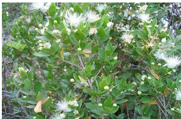
شکل ۱. درختچه مورد در زمان گلدهی

در مطالعات آزمایشگاهی متعدد، اثر ضد میکروبی و ضد قارچی اسانس این گیاه مورد بررسی قرار گرفته است (Ghasemi et al., ۲۰۱۲; Messaoud et al., ۲۰۱۰; Pirbalouti et al., ۲۰۱۰). تاکنون خواص درمانی متعددی از جمله درمان درد و ورم (Rossi et al., ۲۰۰۹)، اثرات آنتی‌اکسیدانی (Messaoud et al., ۲۰۱۲)، از گیاه دارویی مورد گزارش شده است. مورد دارای اثر ضد انگلی بر روی تریکوموناس واژینالیس (Azadbakht et al., ۲۰۰۴) و ژیاودیبا بوده و در درمان زخم‌های آفت دهانی (Bonjar et al., ۲۰۰۴) بسیار مفید است. همچنین از گیاه مورد در درمان عفونت‌های حاد و مزمن دستگاه تنفسی استفاده می‌شود (Khalighi-Sigaroodi et al., ۲۰۱۰).