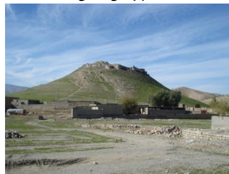
تصویر ۵: دورنمای محوطه‌ی پشت قلعه، دید از شرق