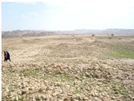
تصویر ۱۲: محوطه‌ی گردال دالپری، بخشی از بناهای موجود