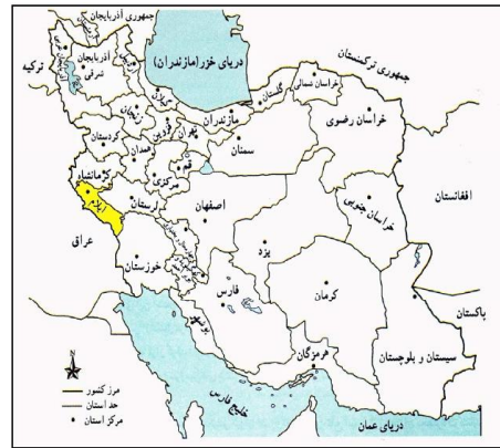
تصویر ۱: نقشه‌ی موقعیت استان ایلام در کشور ایران