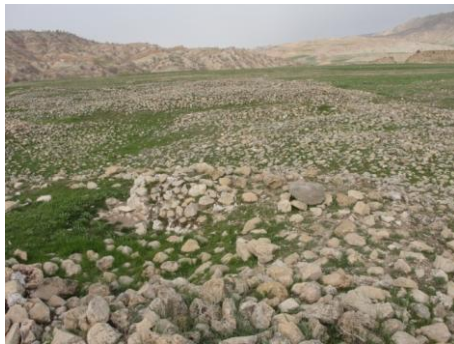
تصویر ۴: محوطه‌ی گیژه، بخشی از آثار موجود