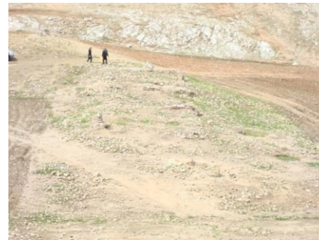
تصویر ۱۱: محوطه‌ی کلک گچ زاغ، بخشی از بناهای موجود