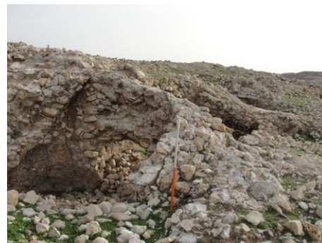
تصویر ۹: محوطه‌ی سراب نقل، بخشی از بناهای موجود