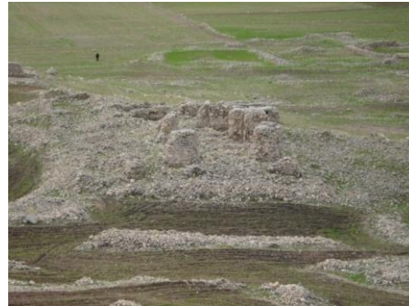
تصویر ۷: محوطه‌ی جولیان، بخشی از بناهای موجود