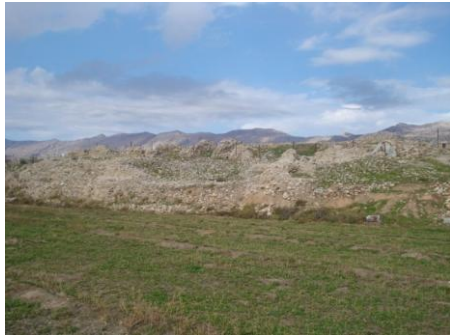
تصویر ۸: سنگر سراب باغ، بنای کل کل، کاروانسرا