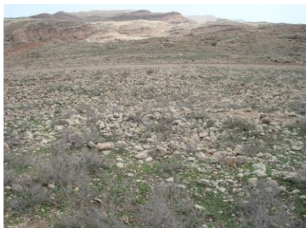
تصویر ۱۴: محوطه‌ی کل قبرستان، دید از شمال