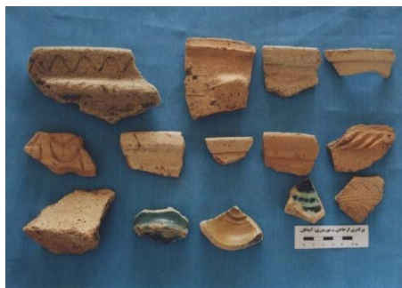
تصویر ۱۳: نمونه سفال‌های محوطه ورکمری گرجاجی