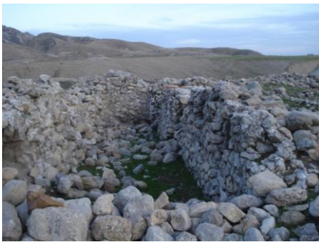
تصویر ۶: محوطه‌ی تلور، بخشی از بناهای موجود