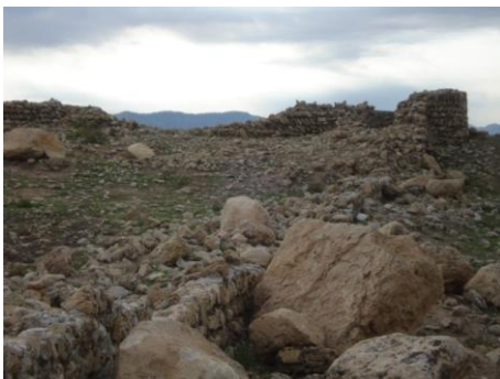
تصویر ۱۰: محوطه‌ی پنج برار، دیوارهای قلعه