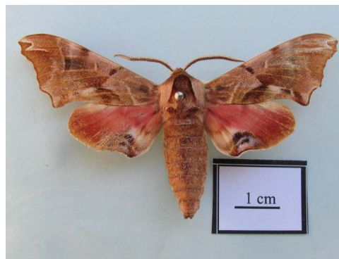
شکل ۱۵ - حشره کامل Smerinthus kindermannii (Lederer, 1853)