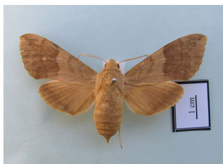
شکل ۴- حشره کامل Clarina kotschy kotschy (Kollar, 1849)