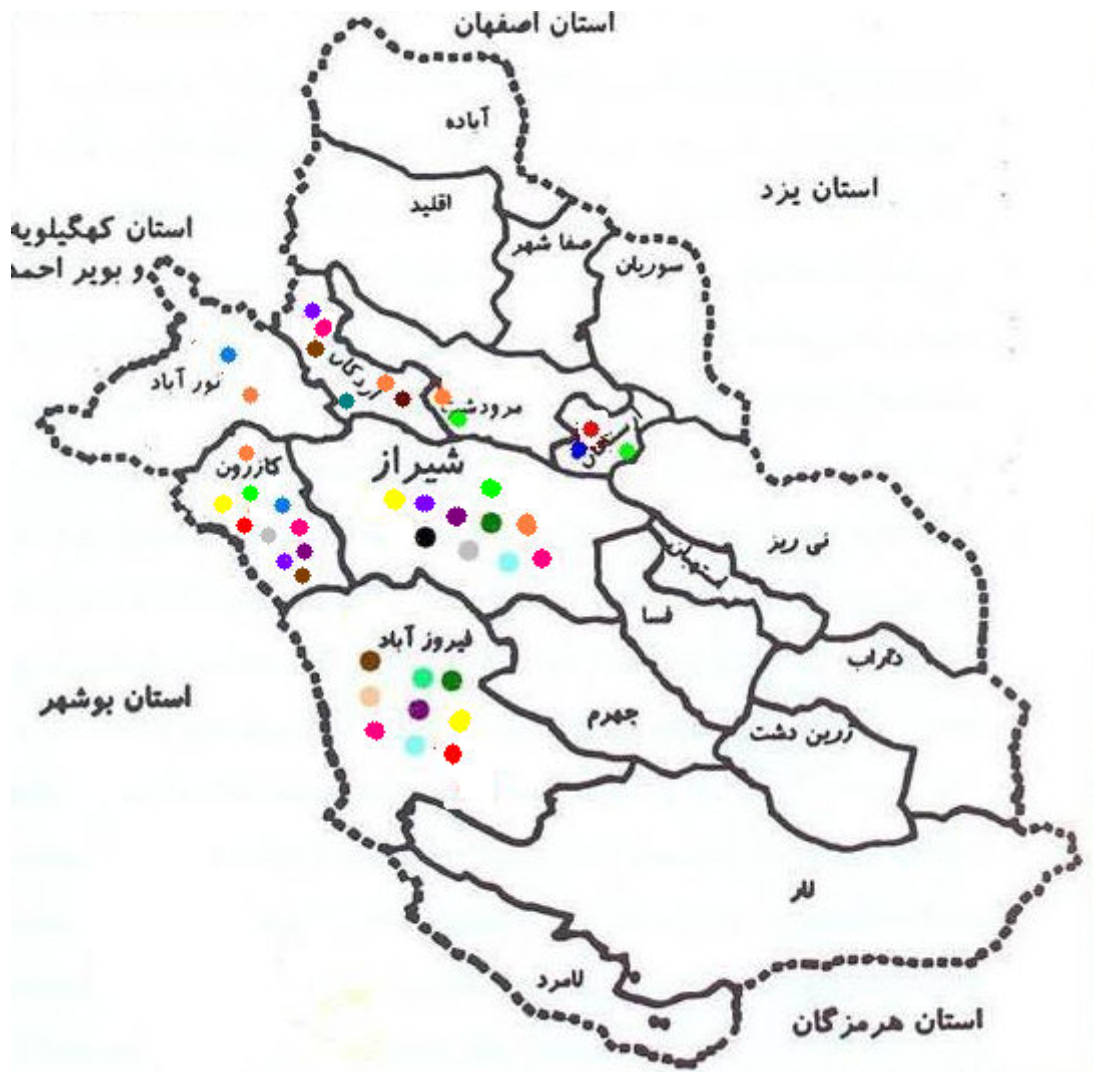
نقشه پراکنش گونه های خانواده Sphingidae در برخی نقاط استان فارس