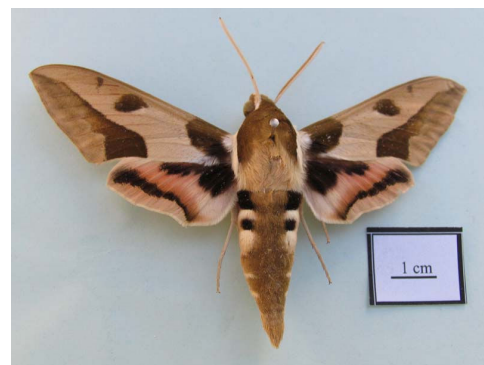
شکل ۹ - حشره کامل Hyles nicaea sheljuzkoi (de Prunner, 1798)