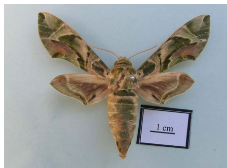
شکل ۵ - حشره کامل Daphnis nerii (Linnaeus, 1758)