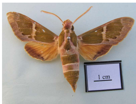
شکل ۱۴ - حشره کامل Rethera komarovi manifica (Brandt, 1938)