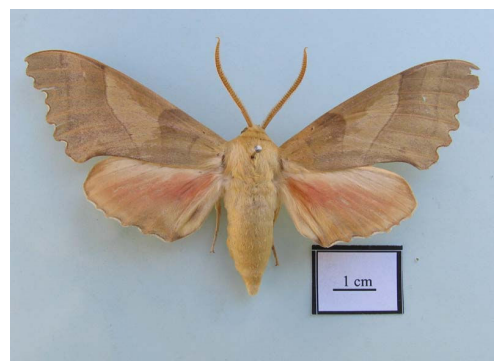
شکل ۱۱ - حشره کامل Marumba quercus (Denis & Schiffermüller, 1775)