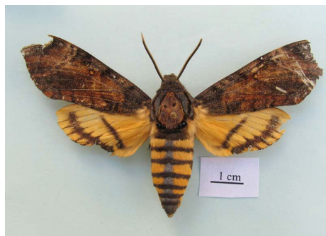
شکل ۱- حشره کامل Acherontia styx styx (Westwood, 1847)