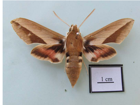
شکل ۷ - حشره کامل Hyles hippophaes bienerti (Esper, 1793)