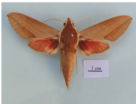
شکل ۱۶ - حشره کامل Theretra alecto (Linnaeus, 1758)