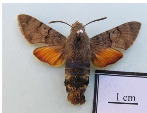
شکل ۱۲ - حشره کامل Macroglossum stellatarum (Linnaeus, 1758)