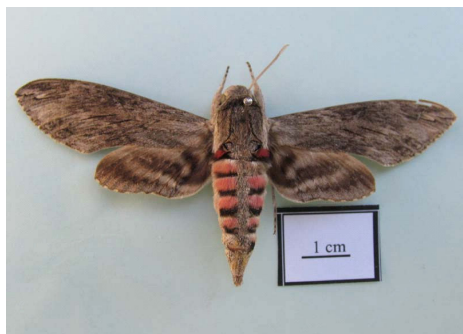
شکل ۲- حشره کامل Agrius convolvuli (Linnaeus, 1758)