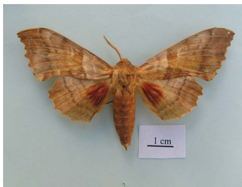
شکل ۱۰ - حشره کامل Laothoe populi populeti (Bienert, 1870)