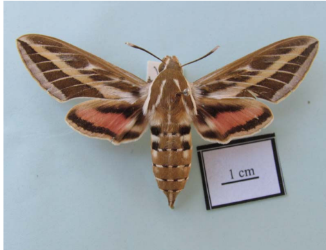
شکل ۸ - حشره کامل Hyles livornica (Esper, 1780)