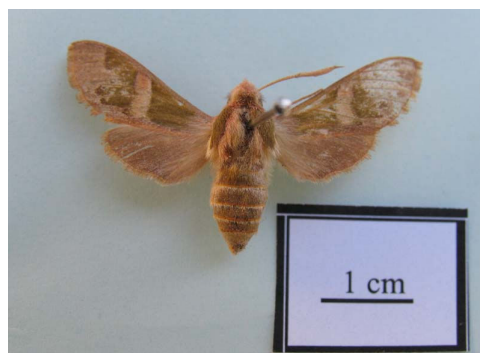
شکل ۱۳ - حشره کامل Rethera brandti eutelets (Jordan, 1937)