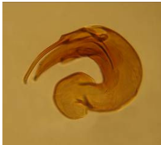
شکل ۳- پارامر گونه Orius niger Wolff

در زیر جنس Microtrachelia پیش گرده حشرات نر و ماده در گوشه‌های جلویی و عقبی دارای موهای بلند و حشرات نر و ماده دارای گوناگونی شکل نیم بالپوش هستند به طوری که در برخی از نمونه‌ها بال‌ها کاملاً شکم را می‌پوشانند و در برخی دیگر بال‌ها کوتاه‌تر و قسمت‌غشایی بال دارای اندازه‌های متفاوت است به طوری که چند مفصل شکم را نمی‌پوشاند (شکل ۱).