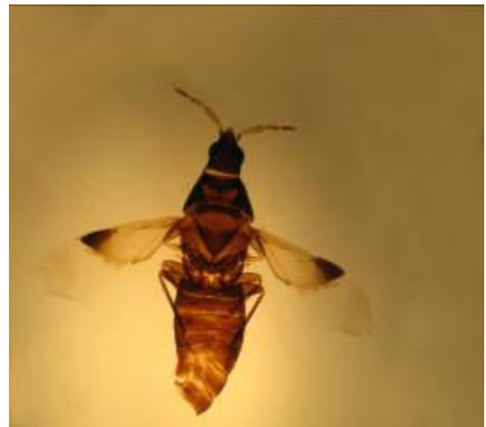
شکل ۱- حشره نر O. retamae