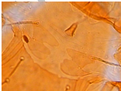
شکل ۶- دو صفحه‌ی چاک‌دار jugular در گونه Cercoleipus n.sp. Figure 6. Two jugular shields with suture in Cercoleipus n.sp.