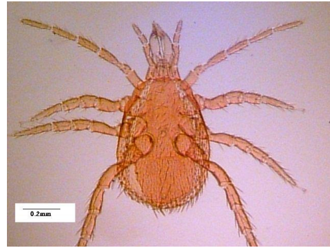
شکل ۱- کنه نر Cercoleipus n.sp. Figure 1. Cercoleipus n.sp. , Male