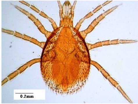
شکل ۲- کنه ماده Cercoleipus n.sp. Figure 2. Cercoleipus n.sp. , Female