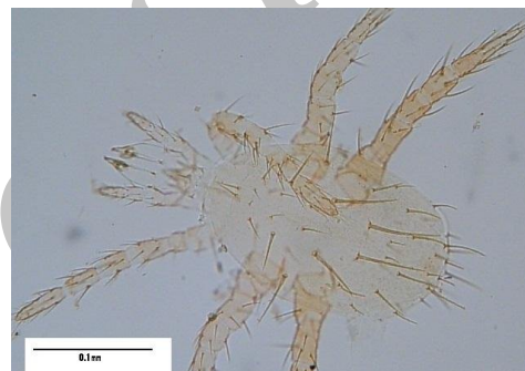
شکل ۳- مرحله لاروی کنه Cercoleipus n.sp. Figure 3. Cercoleipus n.sp. , Larva