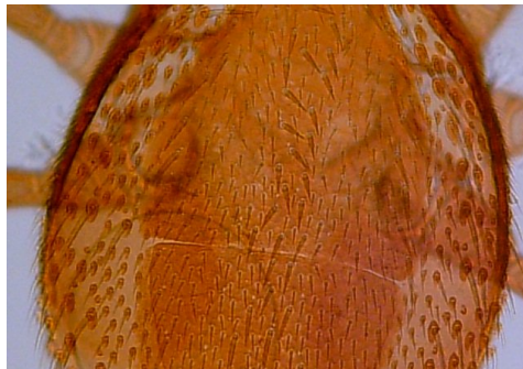
شکل ۴- وجود شکاف بین صفحه‌ی podonotum و opisthonotum در کنه ماده Cercoleipus n.sp. Figure 4. Distinct suture between podonotum and opisthonotum Shields in female of Cercoleipus n.sp.