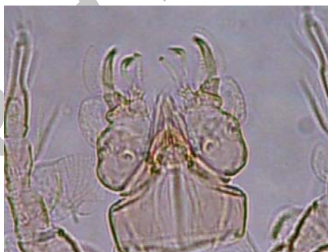
شکل ۱- گناتوزوما در کنه ماده Microcheyla parvula Figure 1. Microcheyla parvula , Gnathosoma of female