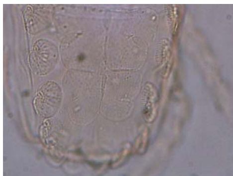
شکل ۳- صفحه هیستروزومایی در کنه ماده Microcheyla parvula Figure 3. Microcheyla parvula , Hysterosomal shield of female