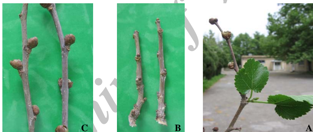
شکل ۲- A: جوانه‌های آلوده به کنه‌ی A. mori ؛ B: جوانه‌های سالم؛ C: جوانه‌های آلوده به کنه در فصل رویش (عکس‌ها اصلی)

سبب ضرر و زیان به باغ‌داران و نوغان‌داران می‌گردد (شکل ۲). با توجه به این که روش‌های تکثیر این درخت مبتنی بر تهیه‌ی پیوندک و همچنین قلمه از درخت مادری می‌باشد استفاده از جوانه‌های سالم ضروری است. بنابراین تشخیص جوانه‌های آلوده به این کنه، نقش مهمی در ازدیاد گیاه در فصل رشد دارد که باغ‌داران در سال بعد یا دو سال بعد متوجه باز نشدن جوانه‌ها می‌گردند. پیشنهاد می‌گردد شاخه‌های دارای جوانه‌های سالم روی درخت مادری حتما در تابستان علامت‌گذاری شده و در فصل مناسب از همین شاخه‌های علامت‌گذاری شده نسبت به تهیه‌ی پیوندک اقدام شود. همچنین در صورت مشاهده‌ی نهال‌های یک‌ساله و دوساله که برخی از جوانه‌های آن متورم و باز نشده‌اند، جهت جلوگیری از شیوع کنه و انتشار آن، نسبت به حذف و سوزاندن آن نهال از نهالستان اقدام گردد. با توجه به مصرف برگ درخت توت برای تغذیه‌ی دام، پرورش کرم ابریشم، تازه خوری میوه و تهیه‌ی خشکبار، مبارزه‌ی شیمیایی علیه این کنه توصیه نمی‌گردد.